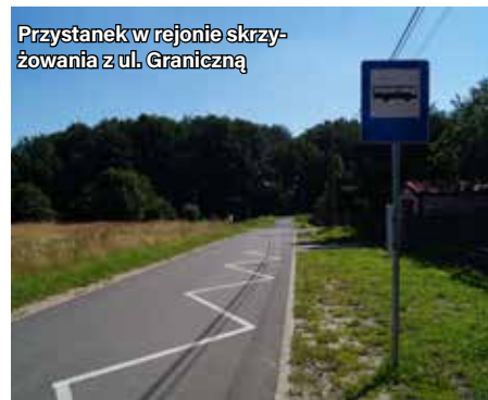
Przystanek w rejonie skrzyżowania z ul. Graniczną