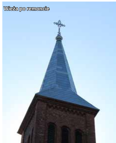
Wieża po remoncie