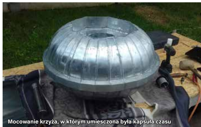
Mocowanie krzyża, w którym umieszczona była kapsuła czasu