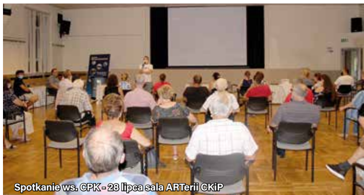
Spotkanie ws. CPK - 28 lipca sala ARTerii CKIP

Podobnie jak to miało miejsce w lutym br. w portierni Urzędu Gminy wystawiono listy – sprzeciw wobec nowych wariantów przebiegu linii kolejowej przez teren Gminy Ornontowice, które można było podpisywać i dostarczać do 29 lipca br. W akcję zbierania podpisów zaangażowali się mieszkańcy, którzy odwiedzali z listami rodzinę i znajomych. Wszystkie