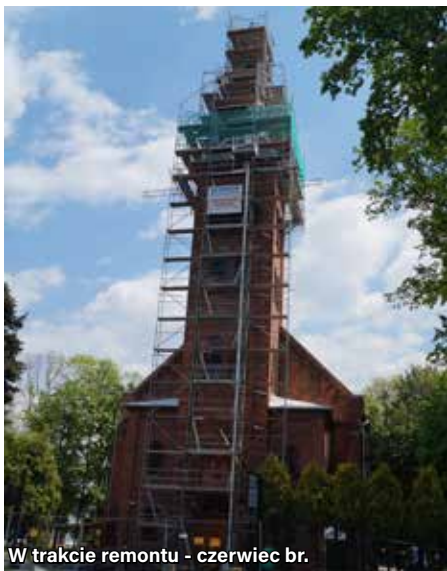
W trakcie remontu - czerwiec br.

W lutym br. Parafia Rzymskokatolicka pw. Św. Michała Archanioła w Ornontowicach otrzymała dotację Fundacji Jastrzębskiej Spółki Węglowej na renowację pokrycia dachu wieży kościoła. Dotowany projekt musiał zostać zakończony do końca sierpnia br. Dach wieży kościoła był rozszczelniony w wielu miejscach, a pokrywająca go blacha cynkowa była w złym stanie technicznym.