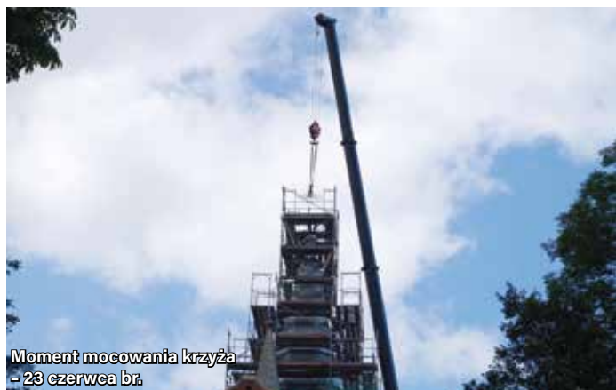
Moment mocowania krzyża - 23 czerwca br.