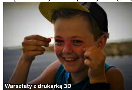
Warsztaty z drukarką 3D

Warsztaty stolarskie , to spotkanie z „majster klepką”, który zamienił nasz Amfiteatr w warsztat stolarski :) Wbrew pozorom własnoręczne skrócenie karmnika dla ptaków nie jest takie proste jak mogłoby