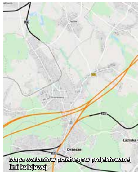
Mapa wariantów przebiegów projektowanej linii kolejowej

zebrane podpisy w liczbie 1725 wraz ze stanowiskiem Wójta Gminy zostały w przewidzianym terminie wysłane na wskazany przez CPK adres w formie cyfrowej i papierowej.