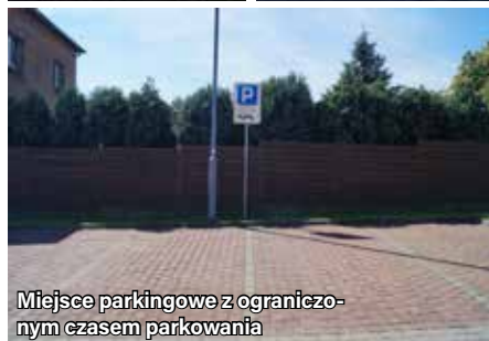
Miejsce parkingowe z ograniczonym czasem parkowania