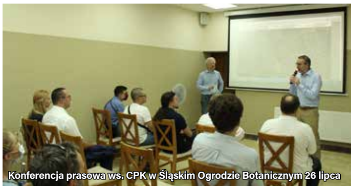
Konferencja prasowa ws. CPK w Śląskim Ogrodzie Botanicznym 26 lipca

Po rozpatrzeniu uwag zgłoszonych w trakcie konsultacji do dokumentu Strategicznego Studium Lokalizacyjnego Inwestycji Centralnego Portu Komunikacyjnego