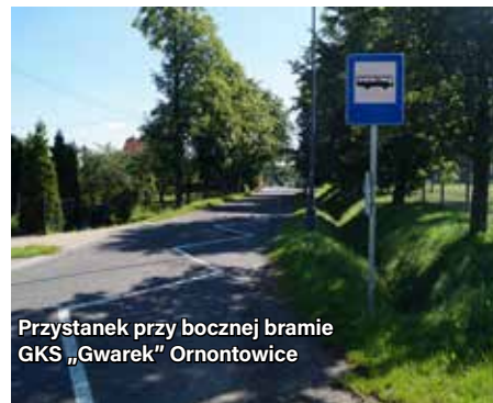
Przystanek przy bocznej bramie GKS „Gwarek” Ornontowice

Zgodnie z wprowadzonymi 6 lipca br. zmianami w rozkładzie jazdy bezpłatnej komunikacji gminnej, przy ul. Nowej usytuowano dwa nowe przystanki, które oznaczono oznakowaniem pionowym i poziomym. Jeden przy bocznej bramie boiska GKS „Gwarek” Ornontowice, drugi w rejonie skrzyżowania z ul. Graniczną. Aktualny rozkład jazdy bezpłatnej komunikacji gminnej dostępny jest na stronie www.ornontowice.pl w zakładce informacje ogólne → komunikacja → rozkłady jazdy.