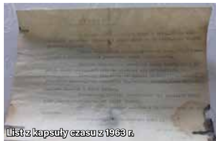
List z kapsuły czasu z 1963 r.

Notatka z roku 1963 zawierała ogólne informacje dotyczące ówczesnego życia parafii, w tym nazwiska biskupów oraz powód remontu. W czerwcu 1963 r. zdjęto krzyż z wieży, ponieważ pochylił się na skutek zacieków i pognicia słupa oraz podtrzymujących go krokwi. Okuto zakończenia więźby, poprawiono kulę, a sam krzyż zamontowano w częściach.