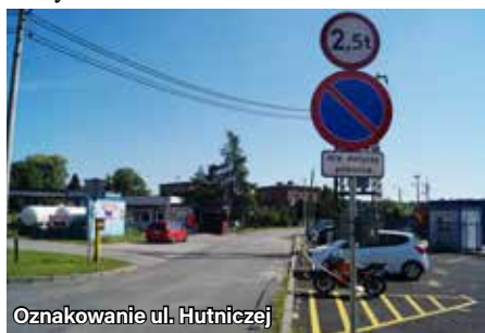
Oznakowanie ul. Hutniczej

Zgodnie z zapewnieniem komisariatu policji w Orzeszu obszar ten jest i będzie w najbliższych miesiącach patrolowany przez funkcjonariuszy, którzy będą zwracać szczególną uwagę na stosowanie się do nowych zakazów.