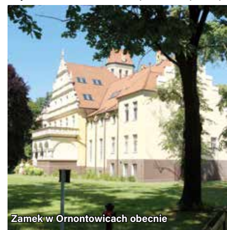
Zamek w Ornontowicach obecnie

Zapraszamy na Biegi Przełajowe o Puchar Przewodniczącego Rady Gminy /Bieg Samorządowca, które odbędą się 12 września 2020 r. (sobota) w Parku Gminnym w Ornontowicach.