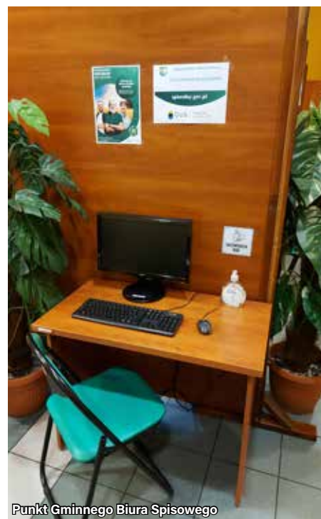
Punkt Gminnego Biura Spisowego

W ankiecie znajdują się też pytania o liczbę, powierzchnię, kubaturę i pojemność budynków gospodarskich. Badanie obejmie rów-