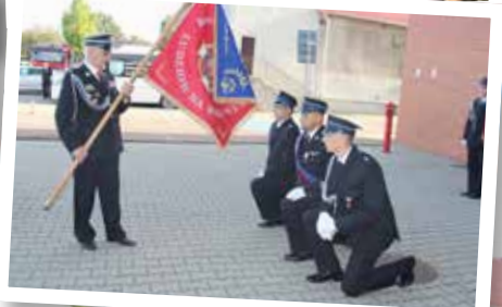
Moment poświęcenia nowego sztandaru