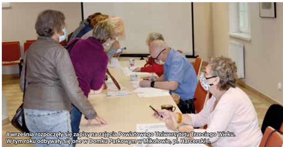
8 września rozpoczęły się zapisy na zajęcia Powiatowego Uniwersytetu Trzeciego Wieku. W tym roku odbywały się one w Domku Parkowym w Mikołowie, pl. Harcerski 1.