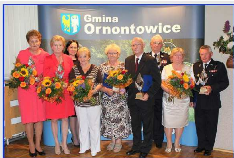
Ornontowickie Bzy 2014

Na mocy Uchwały Nr XXXVIII/241/05 Rady Gminy Ornontowice z dnia 19 maja 2005r., osobom i instytucjom, które swoim działaniem zawodowym lub społecznym w znaczący sposób przysłużyły się rozwojowi Gminy Ornontowice, począwszy od 2005 roku przyznaje się honorowe wyróżnienie w formie statuetki „Ornontowickie Bzy”. W miesiącu maju odbyły się dwa posiedzenia Kapituły, która zdecydowała o przyznaniu statuetek siedmiu laureatom, spośród dziesięciu zgłoszonych kandydatur. W dniu 25 czerwca br. dokonano uroczystego wręczenia Statuetek „Ornontowickie Bzy 2014”.