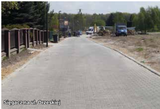
Sięgacz na ul. Orzeskiej

Zakres prac w rejonie posesji 63 i 65 na ul. Orzeskiej obejmował wykonanie kanalizacji sanitarnej i deszczowej, oświetlenia ulicznego oraz wykonanie nowej nawierzchni z kostki betonowej. Wykonawca wykazał się bardzo dużą mobilizacją i zakończył zadanie prawie 3 tygodnie przed terminem.