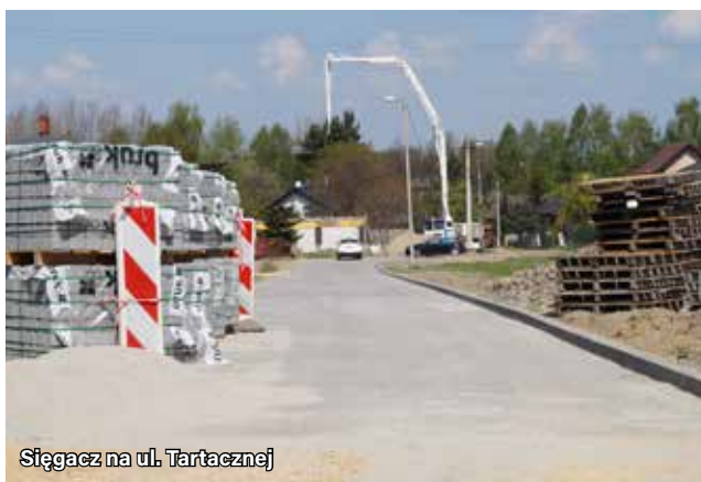
Sięgacz na ul. Tartacznej

Zakres prac obejmuje wykonanie nawierzchni