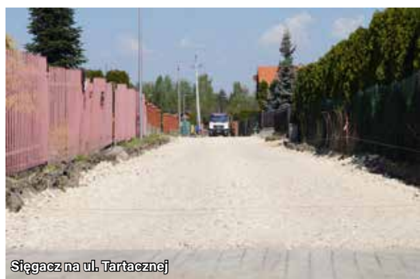
Sięgacz na ul. Tartacznej

Zadanie zostanie zrealizowane do końca maja br. Ogólna wartość robót to 392 785,20 zł brutto. Zadanie dofinansowane z Funduszu Dróg Samorządowych do wysokości 50% kosztów kwalifikowanych.