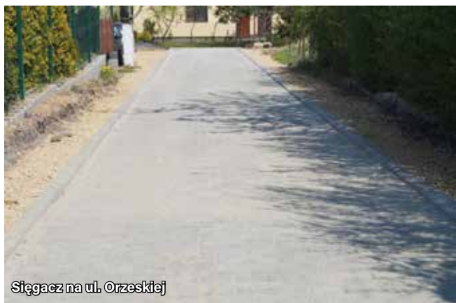
Sięgacz na ul. Orzeskiej

Ogólna wartość robót to 778 500 zł brutto. Zadanie dofinansowane z Funduszu Dróg Samorządowych do wysokości 50% kosztów kwalifikowanych.