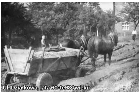
Ul. Działkowa, lata 60-te XX wieku

kamieniami, co utrudniało normalną jazdę dla pojazdów mechanicznych. Wyjeżdżając samochodem z posesji na ul. Orzeskiej i dalej w kierunku ul. Bujakowskiej trzeba