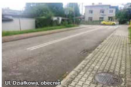
Ul. Działkowa, obecnie