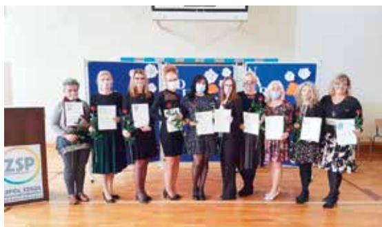
W ZSP uczniowie z okazji Dnia Edukacji Narodowej przyznali wyróżnienia swoim nauczycielom.