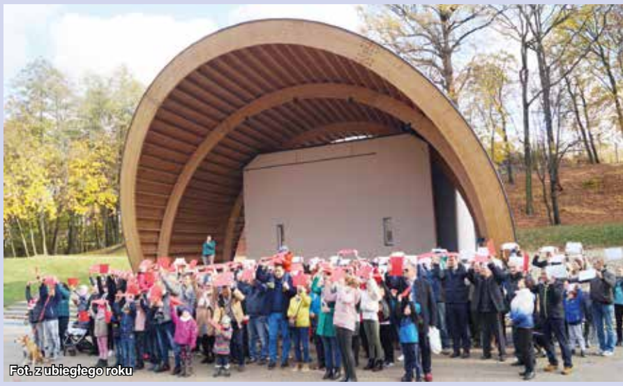
Fot. z ubiegłego roku

Akcja „Niepodległa do hymnu” została zapoczątkowana w 2018 roku przez Biuro Programu „Niepodległa”, w stulecie odzyskania przez Polskę niepodległości.