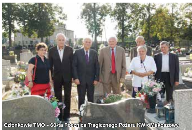
Członkowie TMO – 60-ta Rocznicza Tragicznego Pożaru KWKM Makoszowy

– dokumentacja wspomnień osób starszych;