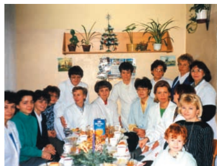
Wigilijka ze współpracownikami ośrodka zdrowia