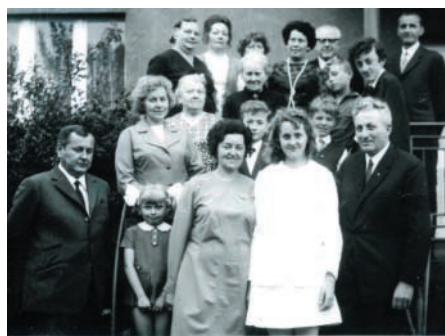
Rodzinna pamiątka z konfirmacji