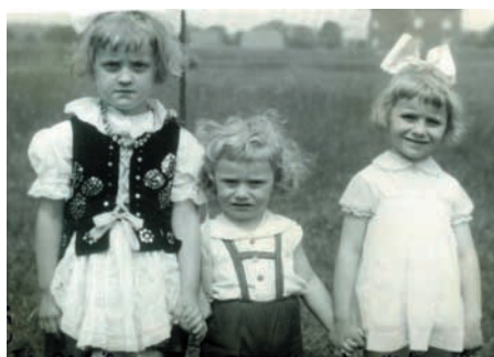
W gronie przyjaciół z dzieciństwa