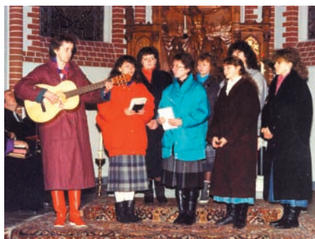
Z zespołem w macierzystej parafii