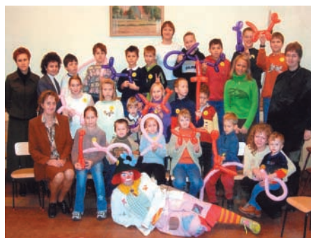
Spotkanie w ramach szkółki niedzielnej