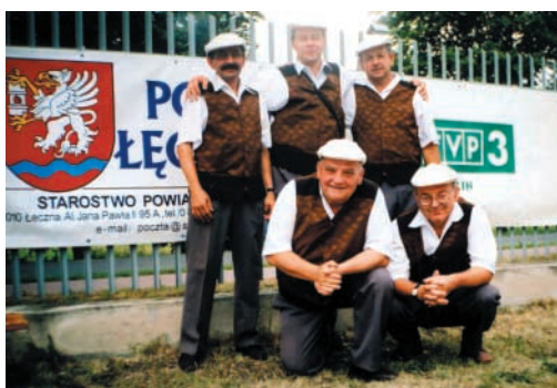
Ornontowicka kapela na festiwalu w Łęcznej – 2005 r.