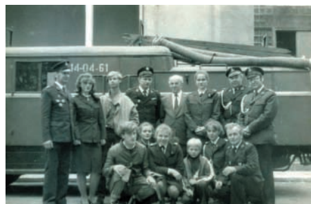
W gronie członków zespołu działającego przy OSP