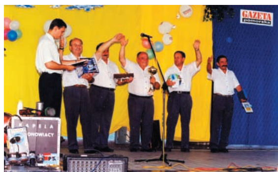
„Śląskie Bajery” – zwycięzca festiwalu w Koronowie – 2001 r.