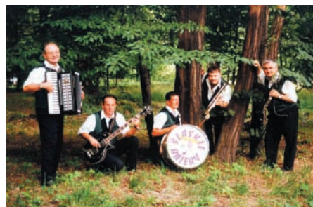
Pierwszy skład kapeli „Śląskie Bajery” – 1998 r.