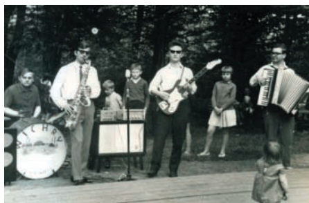
Jako członek ornontowickiego zespołu „Wichry”