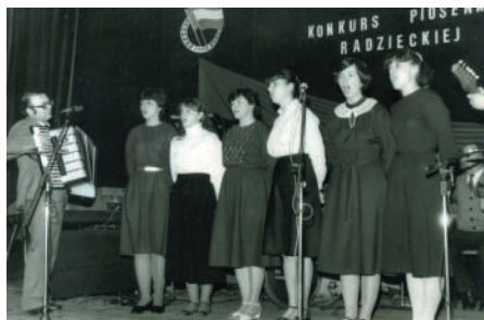
Występ podczas Konkursu Piosenki Radzieckiej