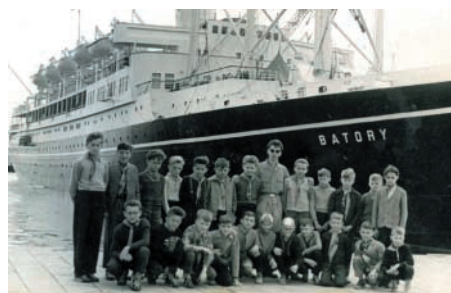
Na wycieczce szkolnej, na tle statku „Batory”