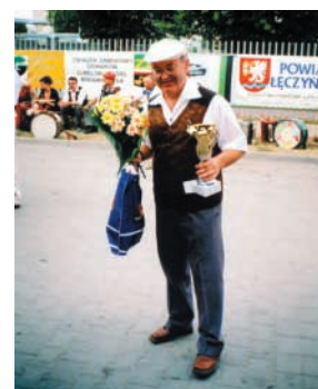
Z festiwalowymi nagrodami