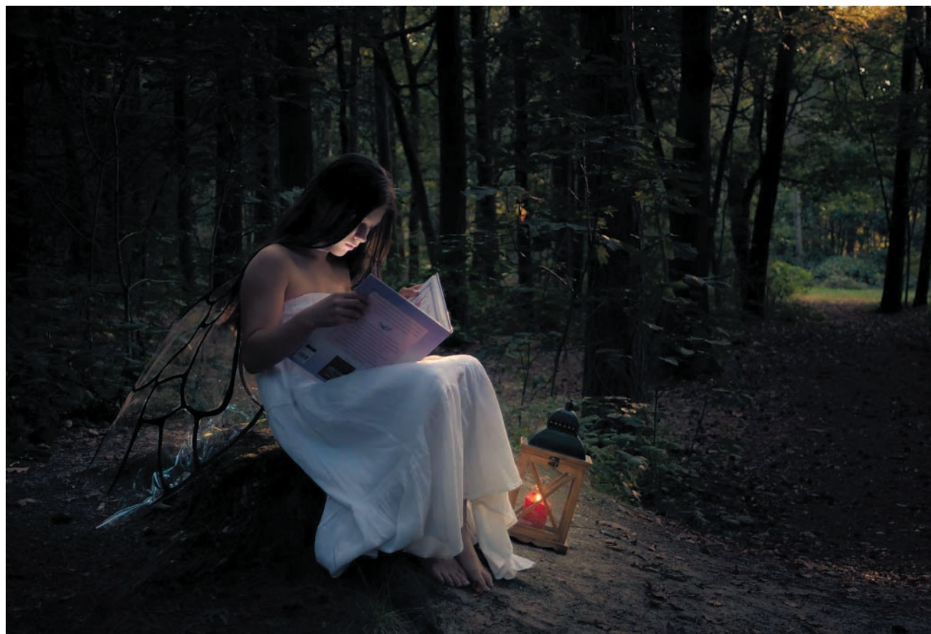
„W krainie baśni”, fotografia Lidii Perlich z Orzesza, zwyciężczyni konkursu w 2014 r.