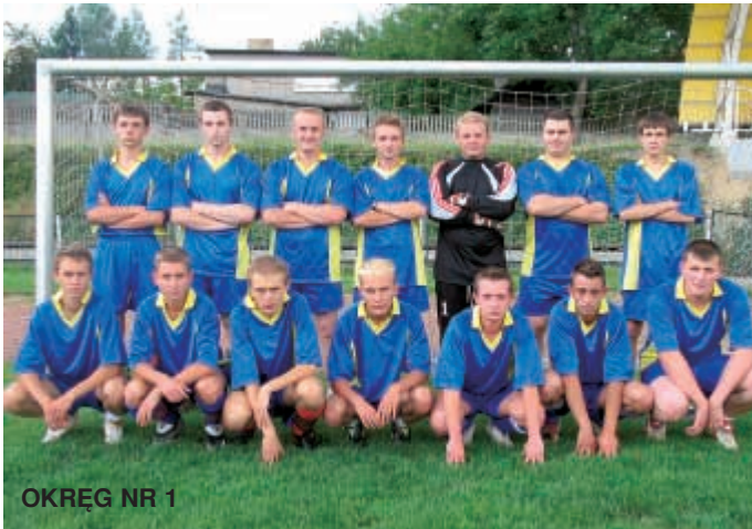
OKRĘG NR 1