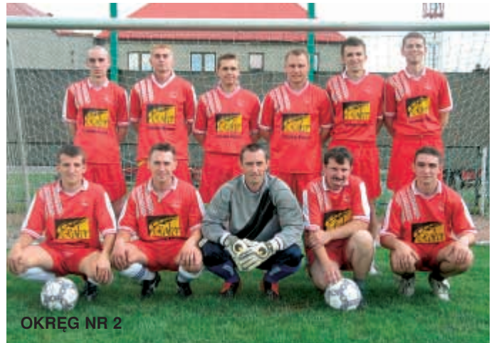
OKRĘG NR 2