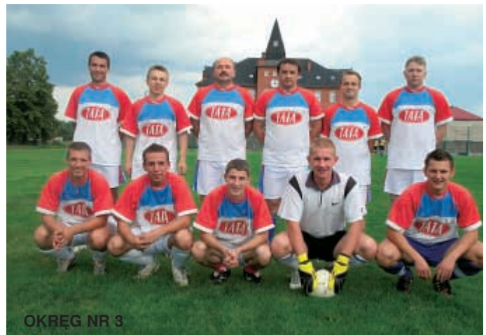
OKRĘG NR 3