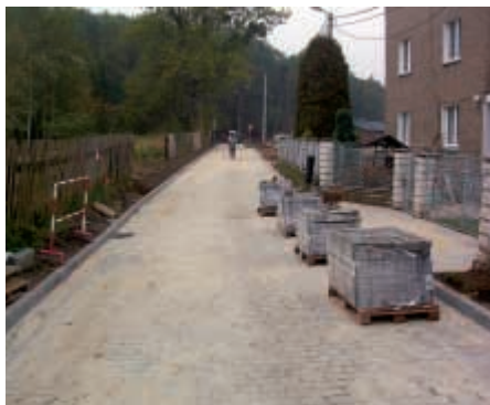
Ulica Tartaczna w trakcie budowy

W związku z powyższymi pracami przepraszamy wszystkich za utrudnienia w ruchu. Jednocześnie zwracamy się z apelem do wszystkich mieszkańców oraz osób przyjezdnych o wyrozumiałość, cierpliwość oraz o zachowanie szczególnej ostrożności podczas poruszania się w rejonach objętych pracami budowlanymi.