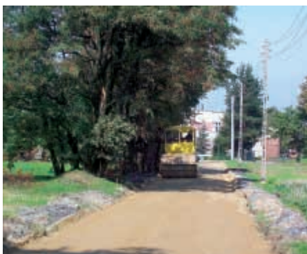
Droga łącząca ulicę Cichą i Nową w trakcie budowy