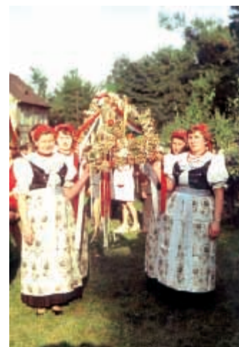
Korona dożynkowa KGW