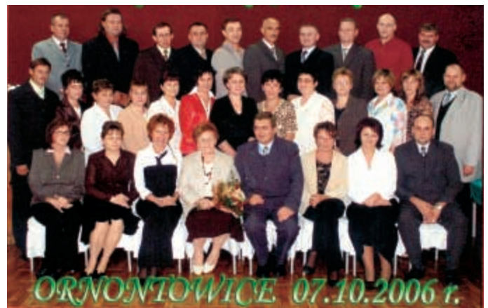
Podczas spotkanie absolwentów z rocznika 1966