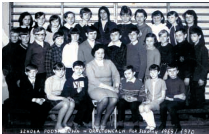
W gronie uczniów kl. VIb w roku szkolnym 1969/70