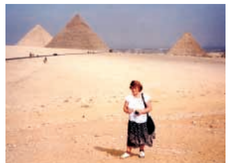
Pamiątka z wyprawy do Egiptu