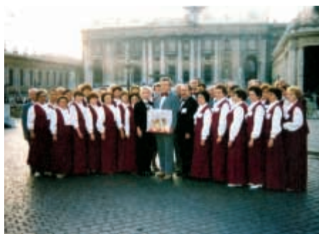
Z chórem „Jutrzenka” na Placu Św. Piotra