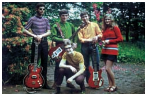
Zespół młodzieżowy z Technikum Rolniczego