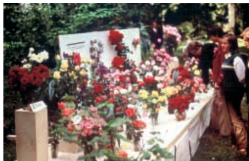
Wystawa róż ciętych