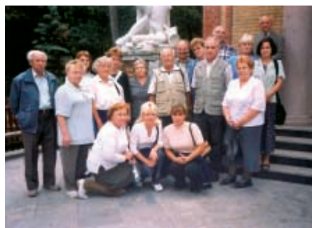
W gronie chórzystów „Jutrzenki”

inie. Szczególne wrażenia wywarły na niej podróże do Egiptu i Ziemi Świętej, Izraela. Na wiele z nich mogła sobie pozwolić dopiero po przejściu na emeryturę w 1983 r., choć ze szkolnictwem w ograniczonym wymiarze zawodowo była jeszcze związana do 1991 r., służąc młodszej kadrze swym długoletnim doświadczeniem i wiedzą. Poza tym od 22 lat jest członkinią chóru „Jutrzenka”, co tylko potwierdza jej wyjątkową aktywność.