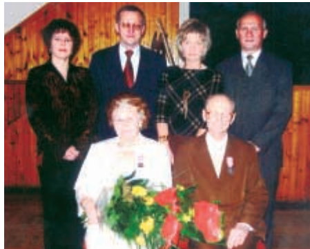
Rodzinna fotografia z okazji Złotych Godów