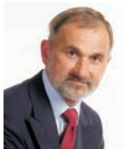
Stanisław Kania nr 2 na liście