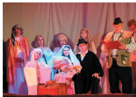
W „Jasełkach” wystąpili dodatkowi aktorzy i zespół „Marzanki”