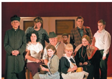
Od marcowej premiery w 2011 r. spektakl „Marika” zobaczyło ponad 5 tysięcy widzów