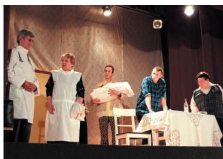
„Hebama” przełożyła na teatralną scenę prawdziwą postać położnej z Ornontowic