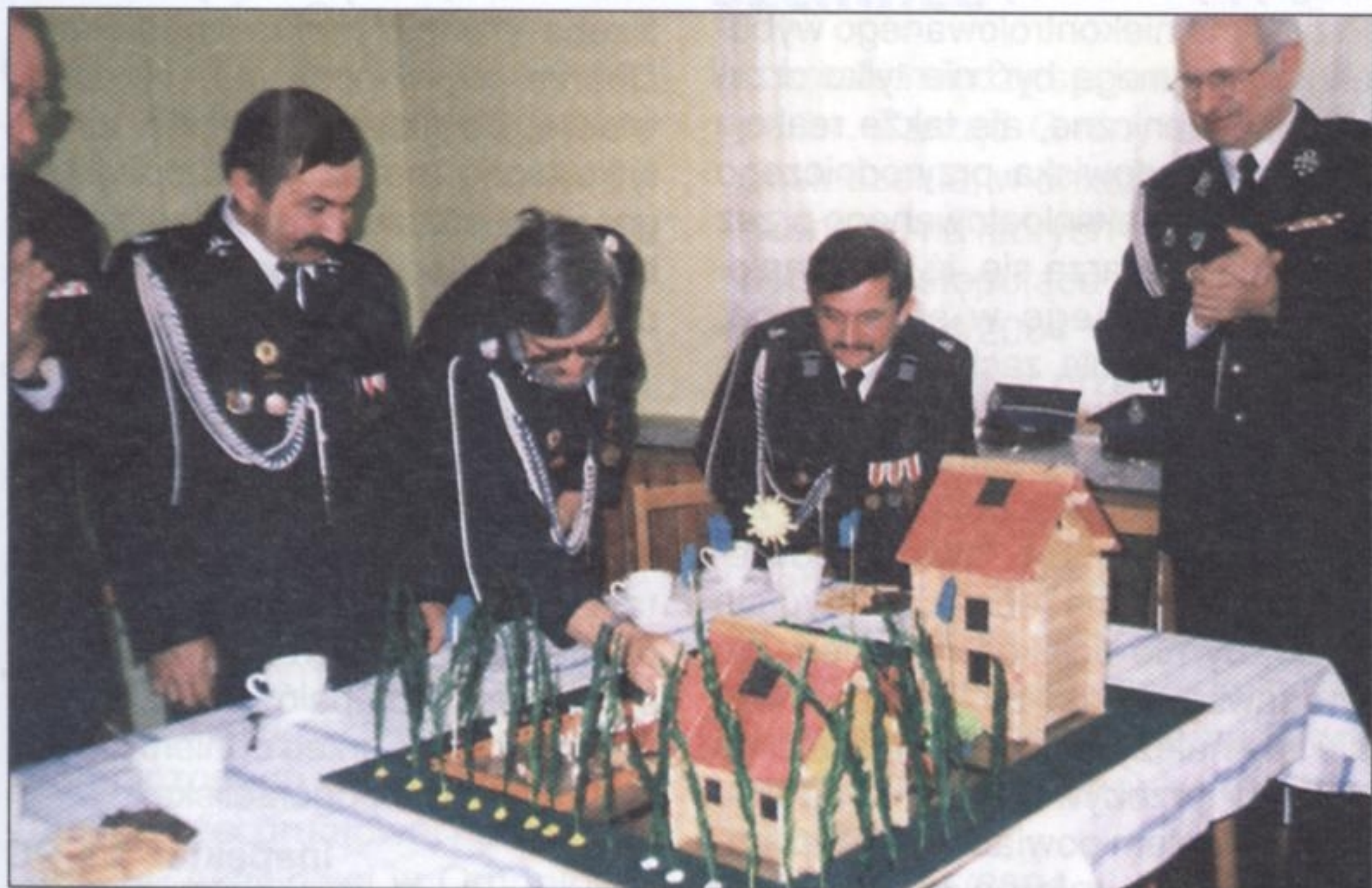
Makieta remizy strażackiej i domu wiejskiego przekazana przez przedszkolaków

– To zaszczyt gościć strażaków i kominiarzy wśród naszych przedszkolaków – mówiła pani dyrektor - gdyż są to ludzie, którzy na co dzień dbają o nasze i naszych bliskich bezpieczeństwo. Tego rodzaju spotkania są kontynuowane od wielu lat i sprawiają naszym dzieciom ogromną radość.