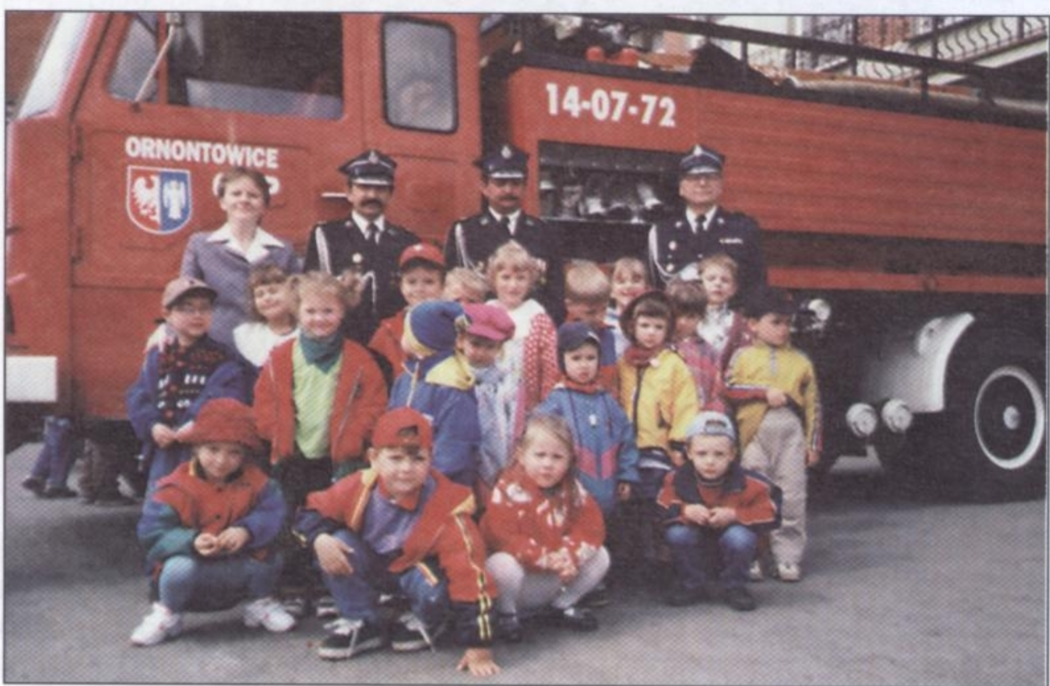
Grupa najmłodszych przedszkolaków na tle samochodu strażackiego