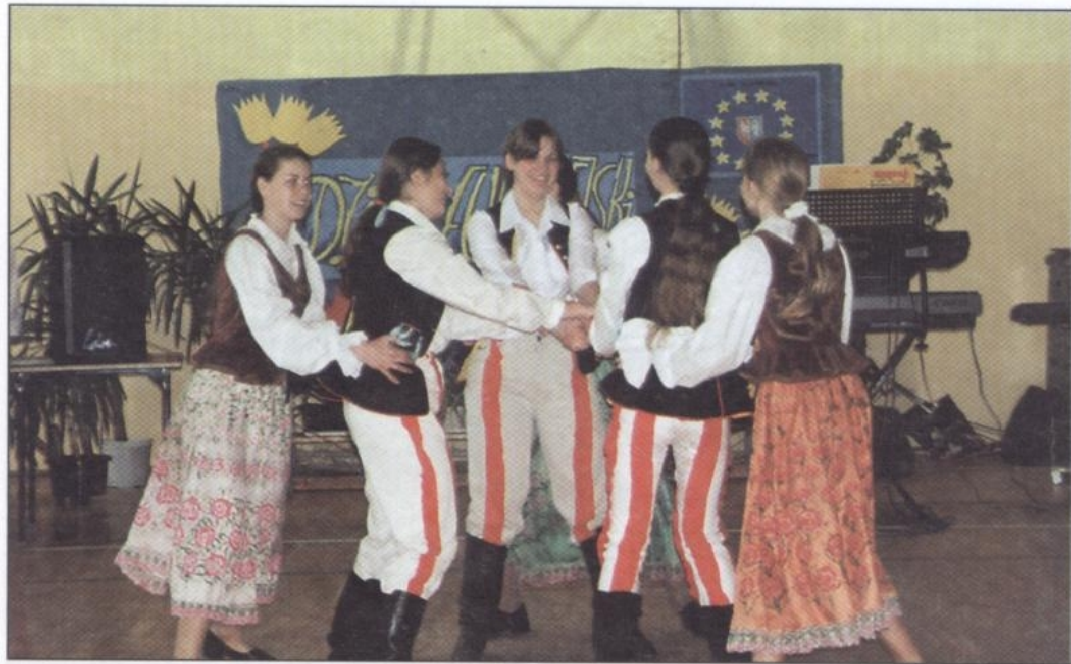
Jeden z tańców europejskich w wykonaniu gimnazjalistów

Członkowie Klubu Europejskiego, do którego należą uczniowie Gimnazjum i Szkoły Podstawowej, przygotowali i prowadzili program całej uroczystości. Wykazali się dużą wiedzą o Europie i Unii Europejskiej. W programie były referaty informujące o UE i krajach członkowskich oraz o Polsce jako kraju starającym się o członkostwo. Były wykonywane tańce i piosenki różnych krajów. Śpiewano w języku włoskim, francuskim,