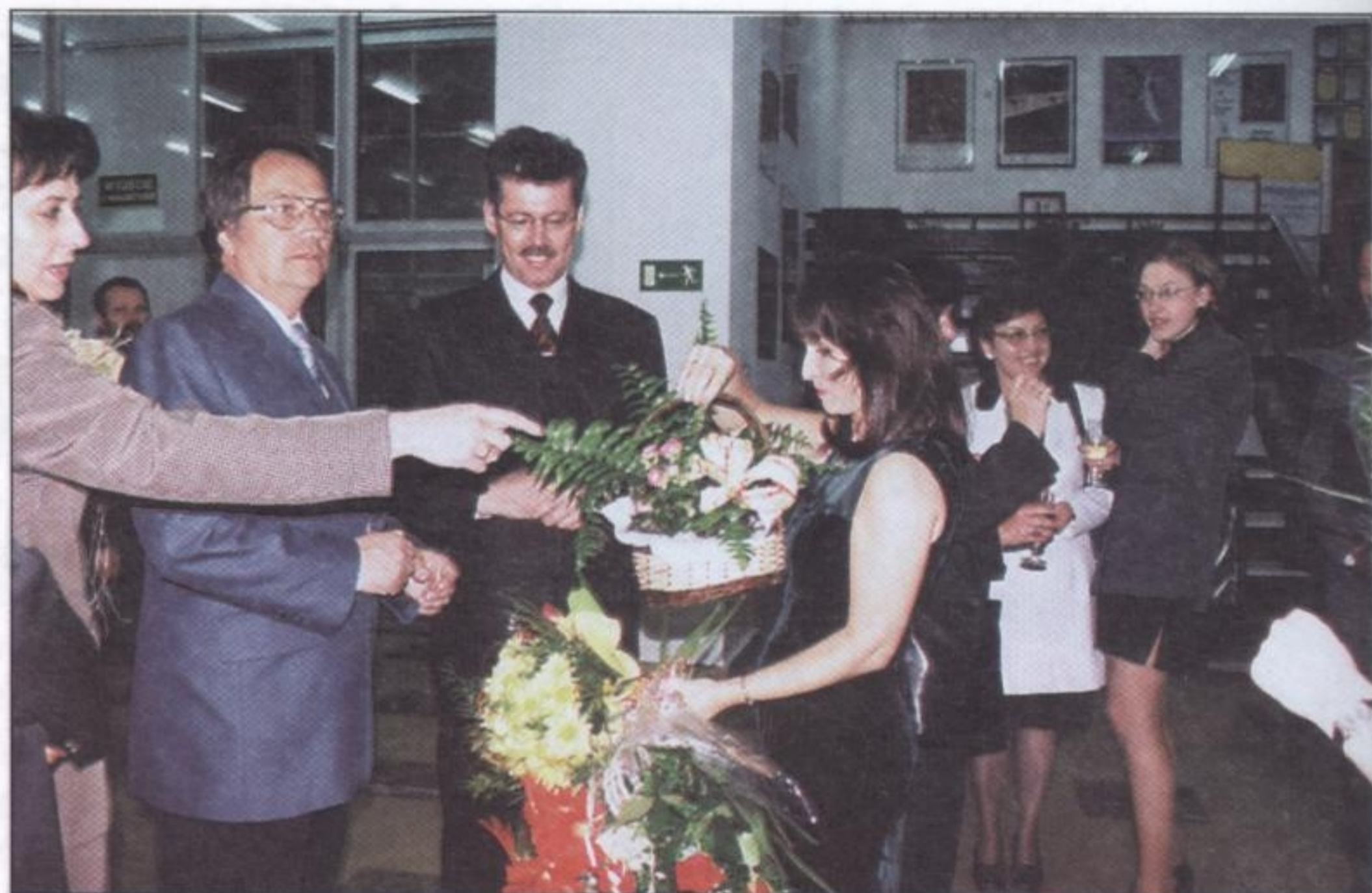
Gośćmi rybnickiego wernisażu były władze samorządowe naszej gminy