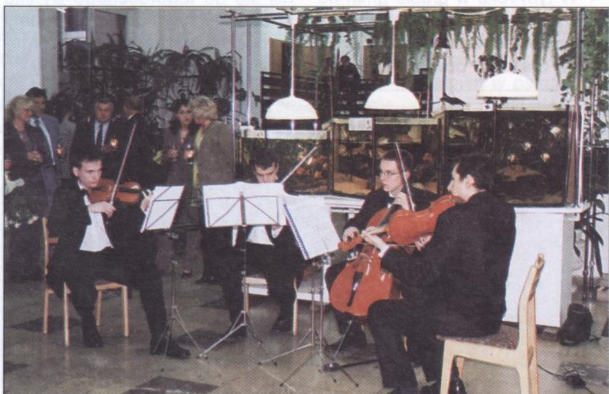
Odpowiednią do scenerii oprawę muzyczną zapewnił występ kwartetu smyczkowego

mi słowy, nie wszystko jest na sprzedaż... „Chyba, że będzie aż tak źle” – mówi sama autorka. Póki co cieszy się popularnością swych wystaw. W Rybniku – w gronie przyjaciół i wielbicieli jej talentu – byli m.in. przewodniczący Rady Powiatu Mikołowskiego, przewodniczący Rady Gminy Ornontowice wraz z małżonką, wójt gminy oraz jego zastępca. (r)