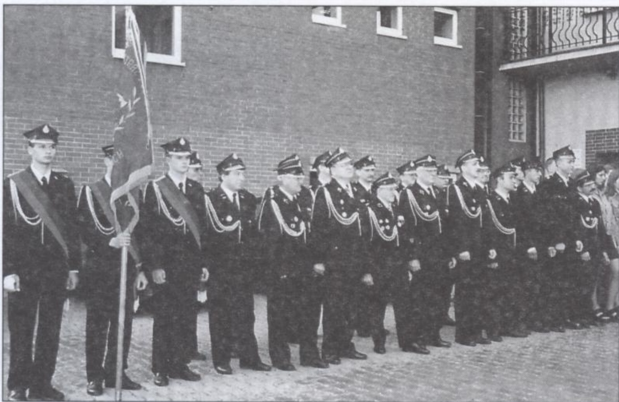
Uroczysta zbiórka ornontowickich strażaków przed remizą OSP