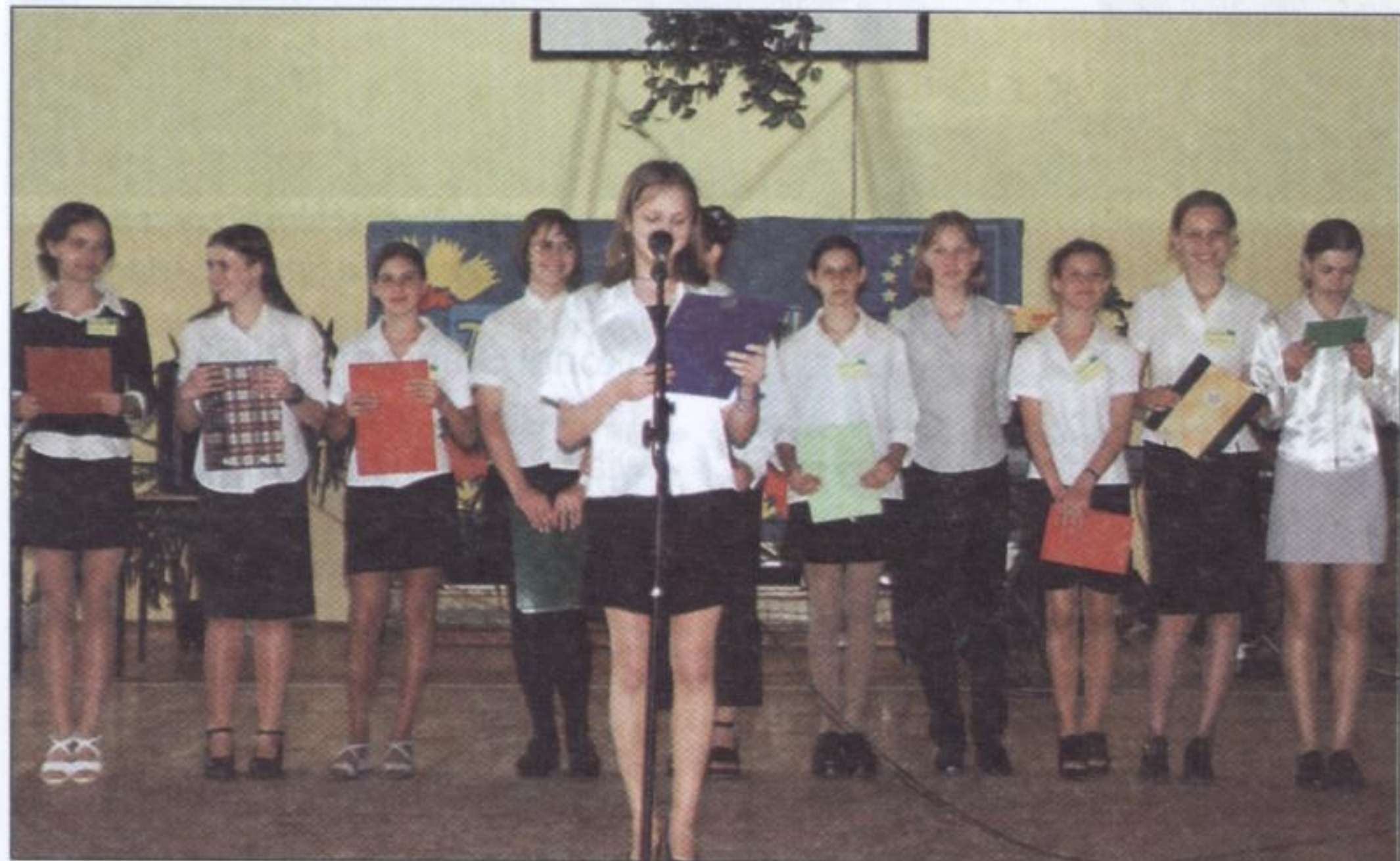
Poszczególne kraje Unii Europejskiej młodzież zaprezentowała w ciekawych referatach

7 maja br. w ornontowickim Gimnazjum obchodzony był Dzień Europejski. Na uroczystość tą zaproszono przewodniczącego Rady Gminy, wójta, sponsorów imprezy oraz dyrekcję, nauczycieli Gimnazjum i Szkoły Podstawowej oraz uczniów.