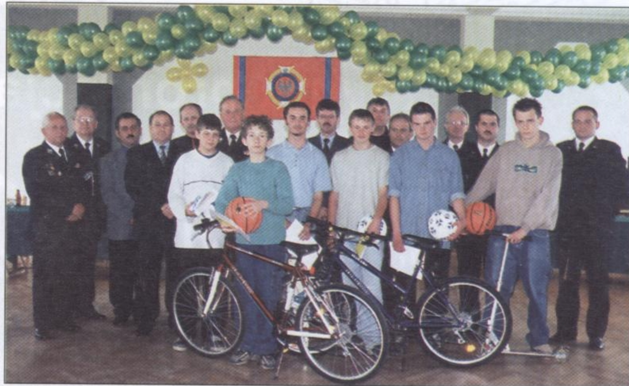
Grupa laureatów tegorocznych eliminacji w towarzystwie organizatorów i zaproszonych gości

nanych przez Zarząd Główny Związku OSP RP i materiałów zamieszczonych na łamach „Strażaka”.