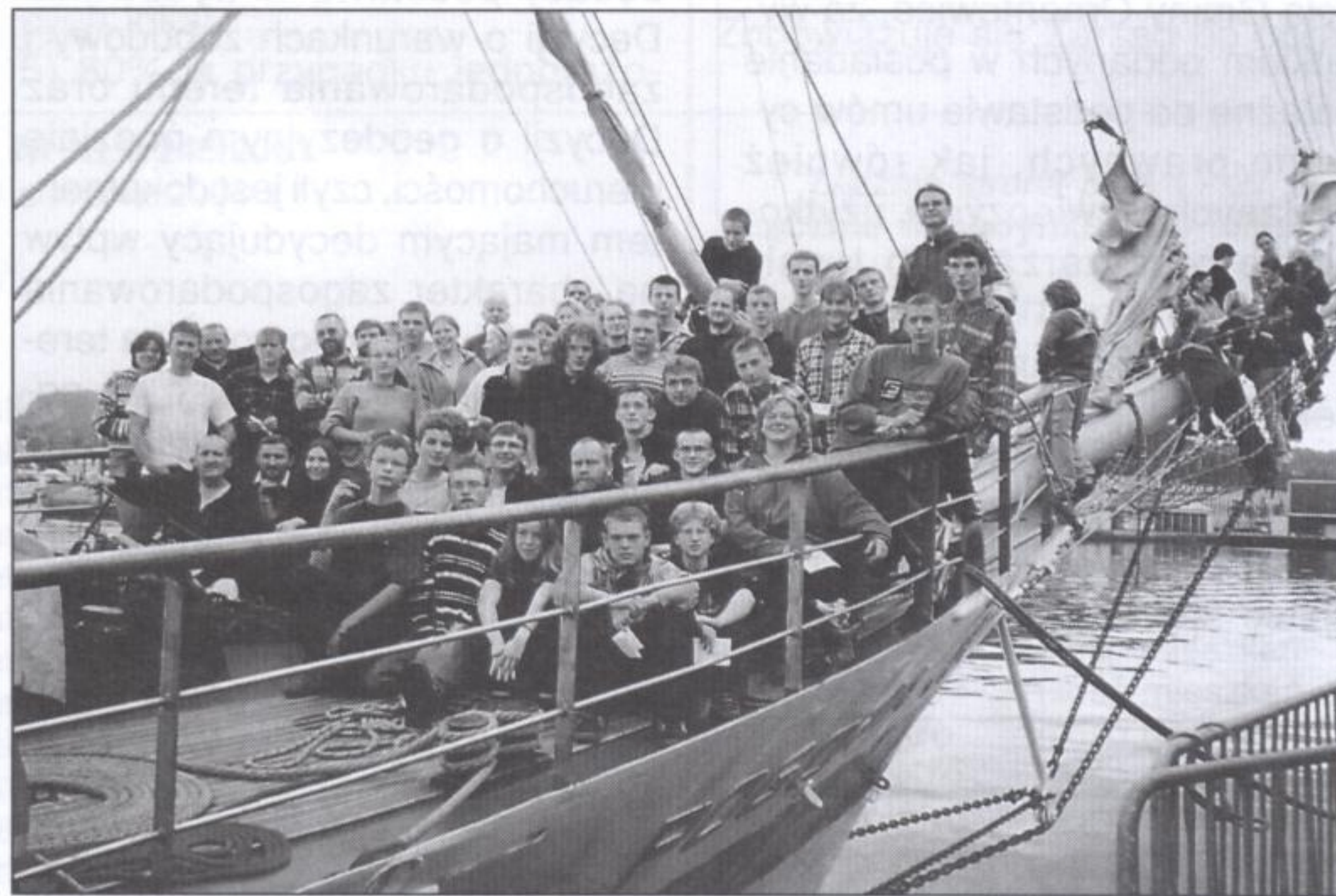
Pamiątkowe zdjęcie uczestników rejsu

Niełatwe zadanie stoi także przed tak zwanym „okiem” - wypatrywanie zbliżających się statków, kiedy na pokład wlewają się fale - nic dodać, nic ująć. Wtedy można poczuć smak żeglownia... Smak, który jest tak niepowtarzalny, że nie może równać się z niczym innym.