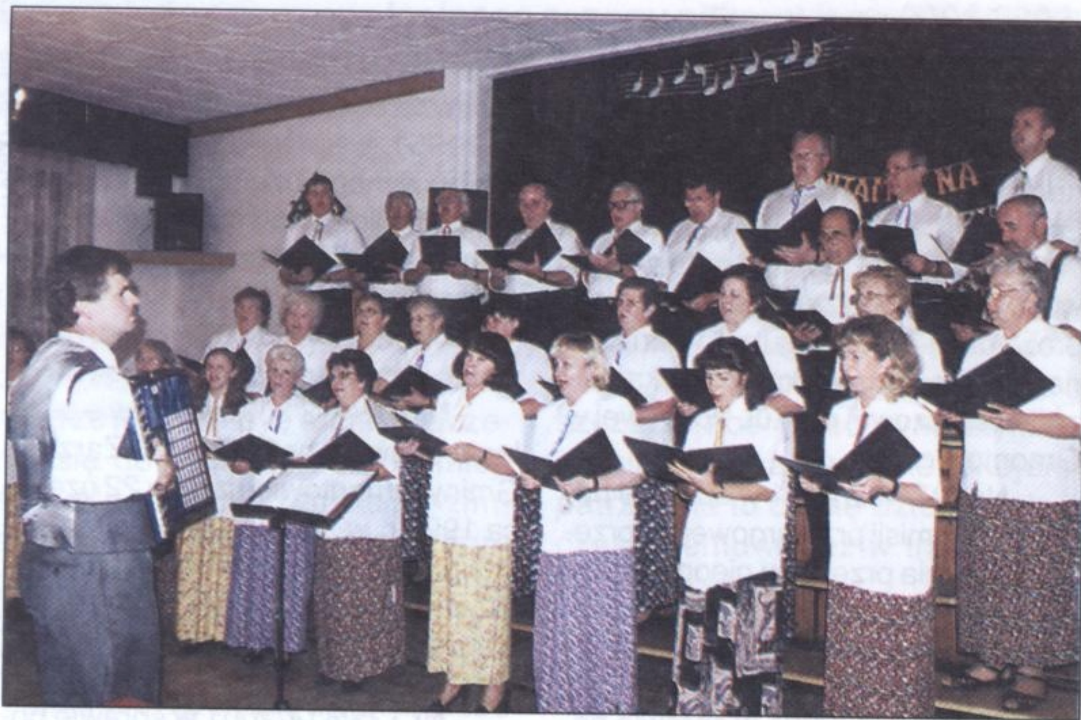
„Chopin” z Bujakowa