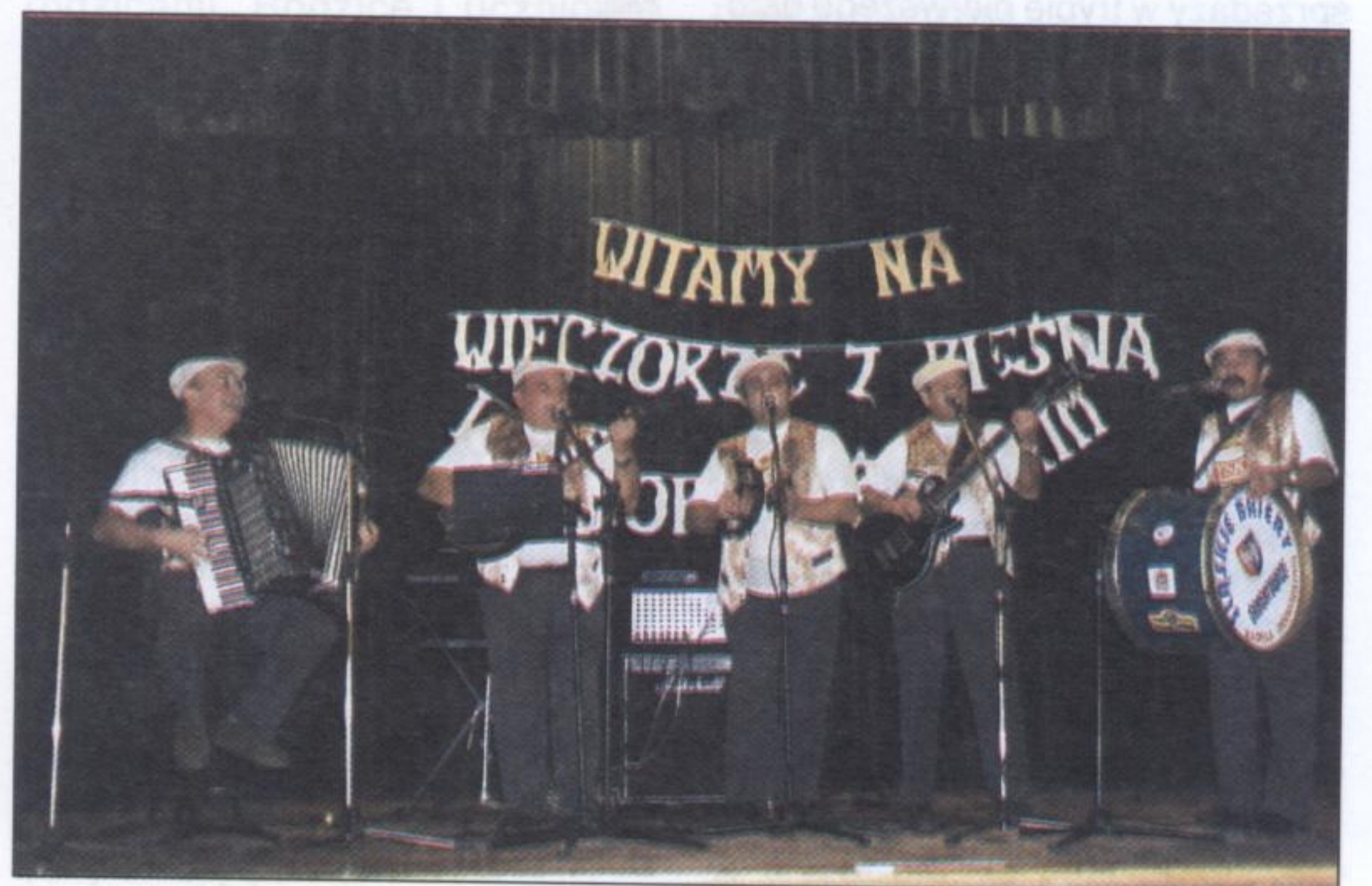
jak i „Śląskich Bajerów” nie trzeba przedstawiać