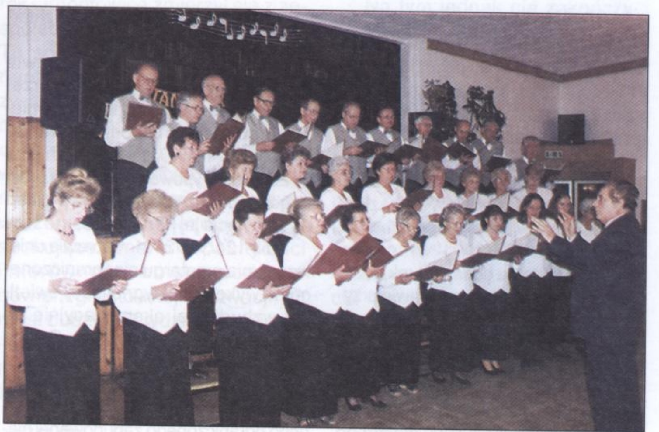
„Dzwon” z Orzesza

...Także spotkania zespołów śpiewaczych bodaj na stałe weszły do kalendarza imprez kulturalnych, jakie są organizowane w Gminnym Domu Kultury. Przed ponad rokiem „Marzanki” na swym jubileuszu gościły „Mikołowianki”, nieco wcześniej Święto Niepodległości uświetnił występ Słowaków, innymi zaś razy prezentowali się Chorwaci. Podczas ubiegłorocznej edycji „Wieczoru z pieśnią i humorem śląskim” do Ornontowic zawiтали „Jaśkowiczanie” i „Gostynianki”. W tym roku gościliśmy okoliczne chóry.