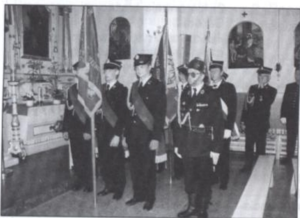
Poczet sztandarowy OSP podczas uroczystego nabożeństwa w kościele