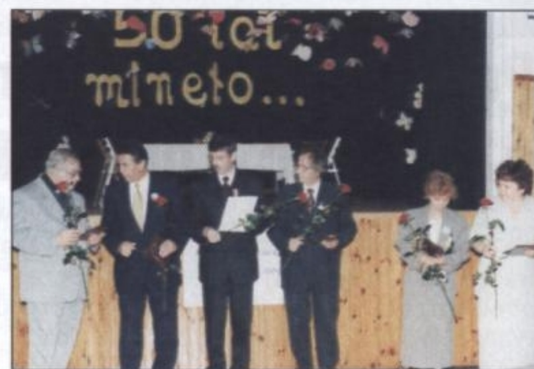
Grupa osób wyróżniona okolicznościowymi dyplomami