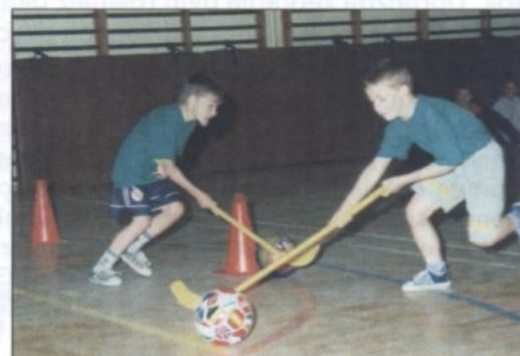
W trakcie festynu rozgrywano również konkurencje sportowe