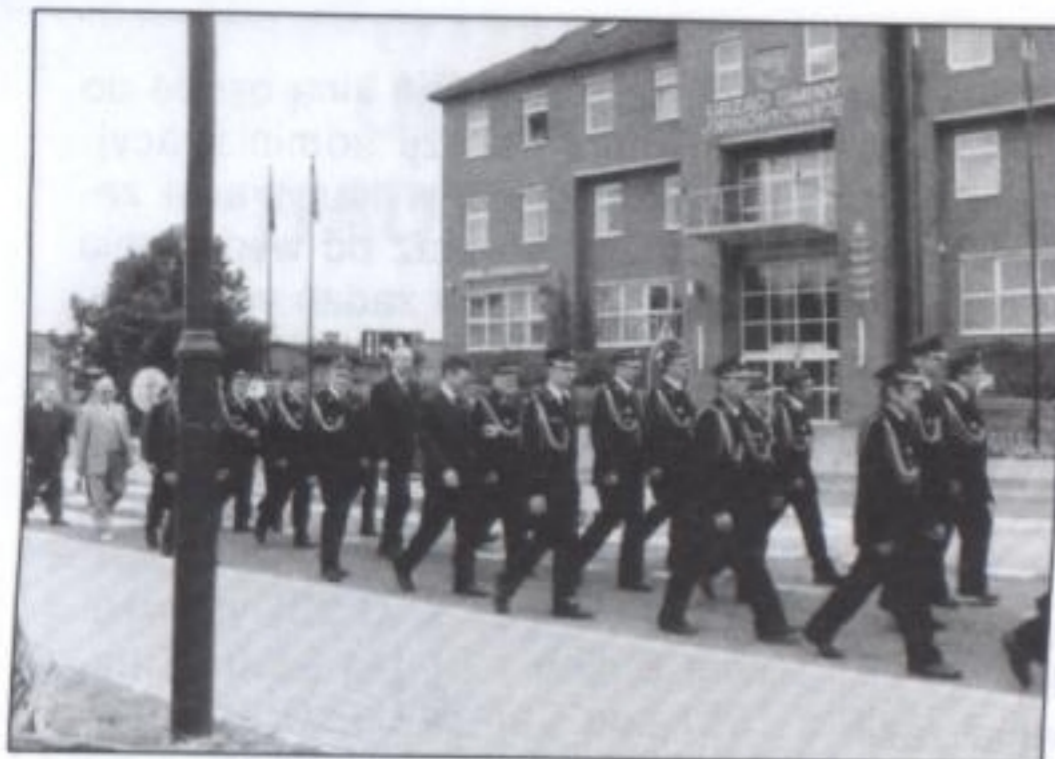
Przemarsz przed Urzędem Gminy w kierunku ornontowickiego kościoła