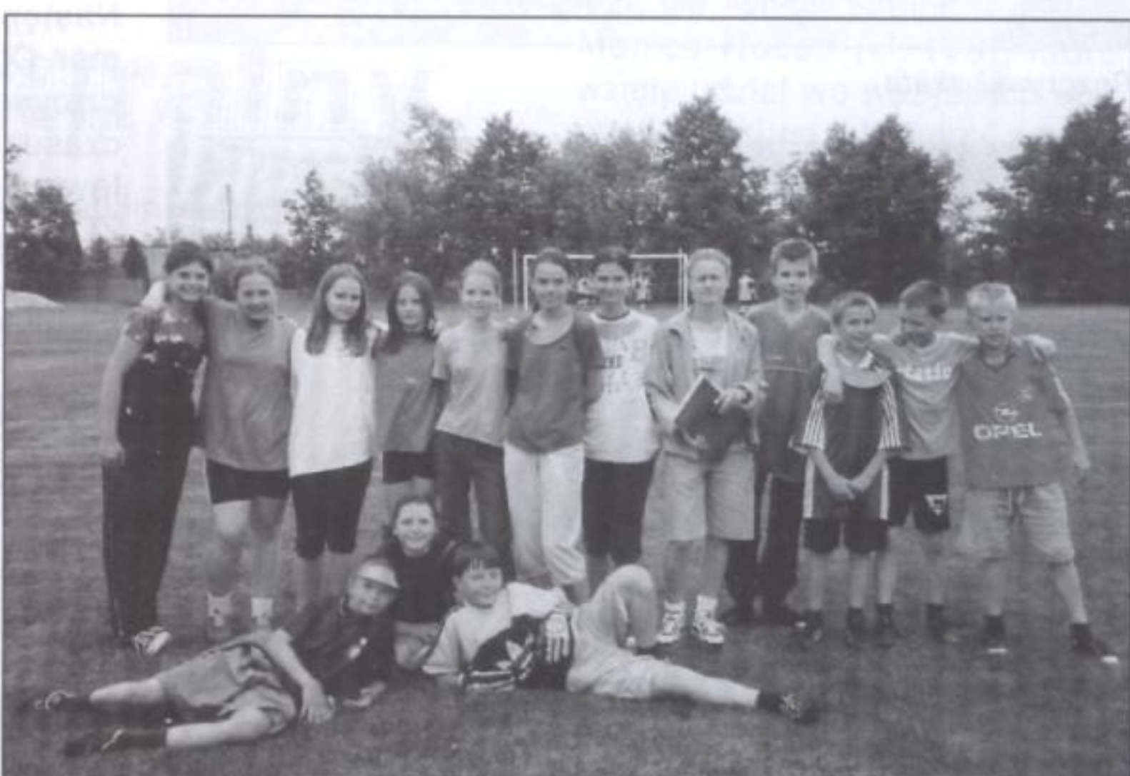
Młodzież szkolna uczestnicząca w tegorocznym turnieju