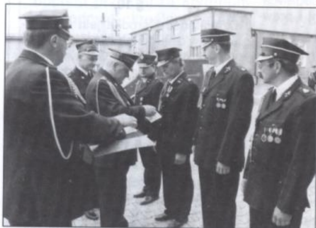
Jubileusz był okazją do uhonorowania zasłużonych strażaków