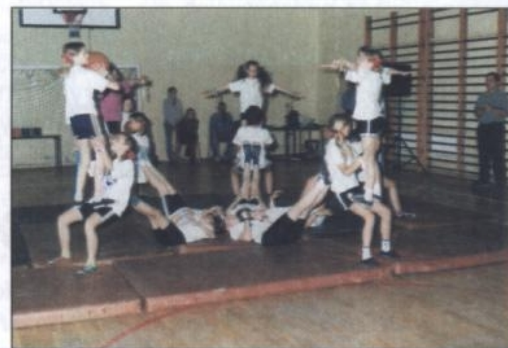
Popis gimnastyczny w wykonaniu młodzieży szkolnej

Z okazji 50-lecia placówki w Gminnym Domu Kultury odbywały się również spotkania jubileuszowe dla uczniów, zaś 8 czerwca br. na terenie szkoły zorganizowano festyn, w którym uczestniczyli także rodzice uczniów. (r)