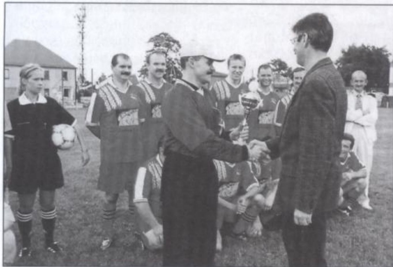
Puchar Wójta dla „Południa”