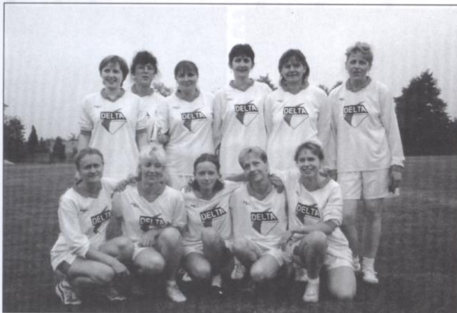
Drużyna rodziców i nauczycieli

25 maja br. w naszej gminie odbyła się kolejna edycja Sportowego Turnieju Miast i Gmin, w tym roku połączona z obchodami Dnia Dziecka. Przez cały dzień organizowano różne zajęcia sportowe, gry zespołowe, zawody i wycieczki rowerowe.