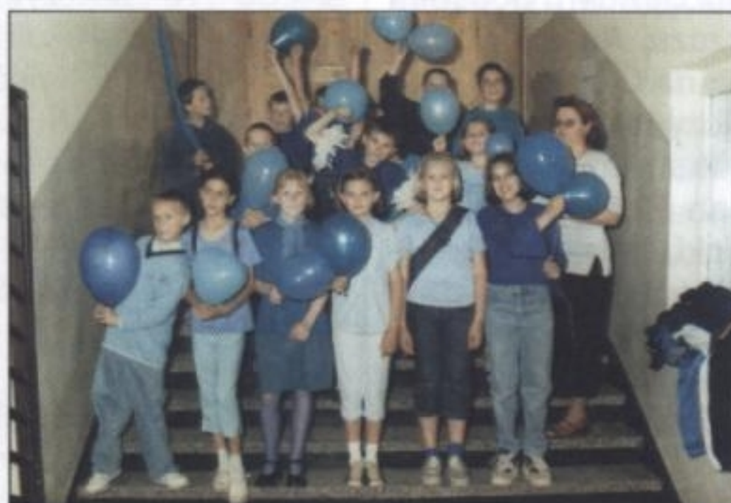
Zespoły klasowe przebrane na festyn z okazji jubileuszu szkoły