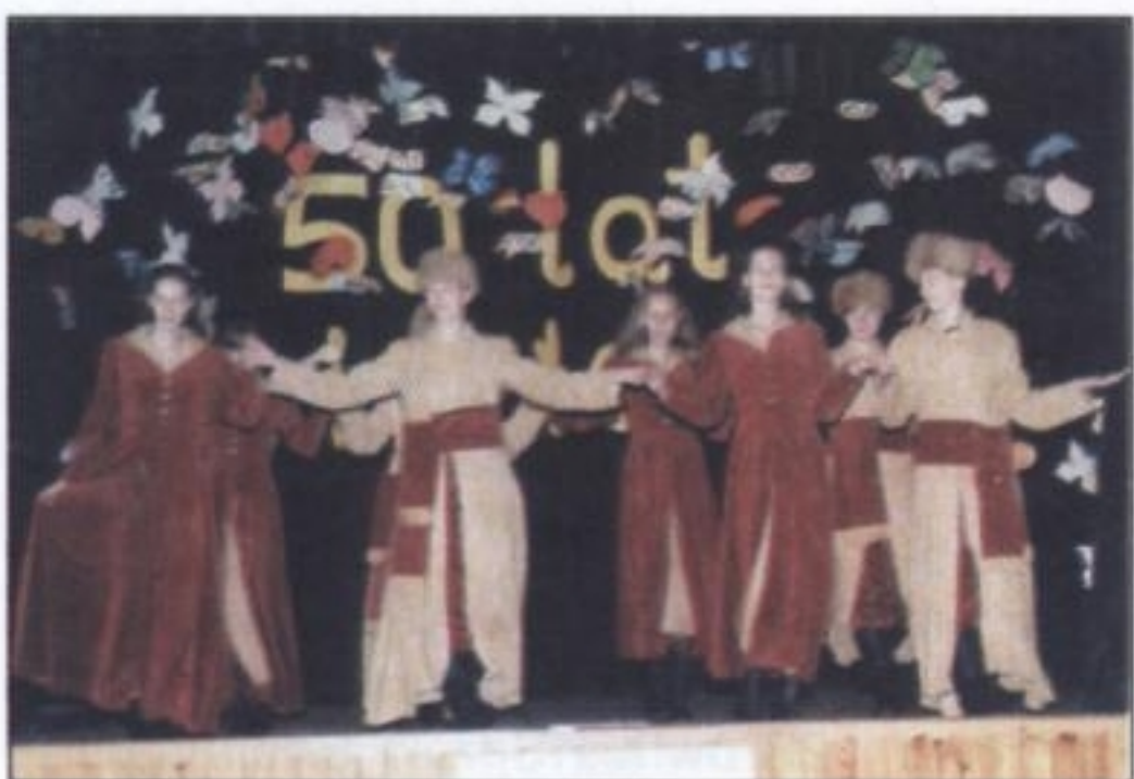
Podczas jubileuszowej akademii młodzież tańczyła w strojach staropolskich