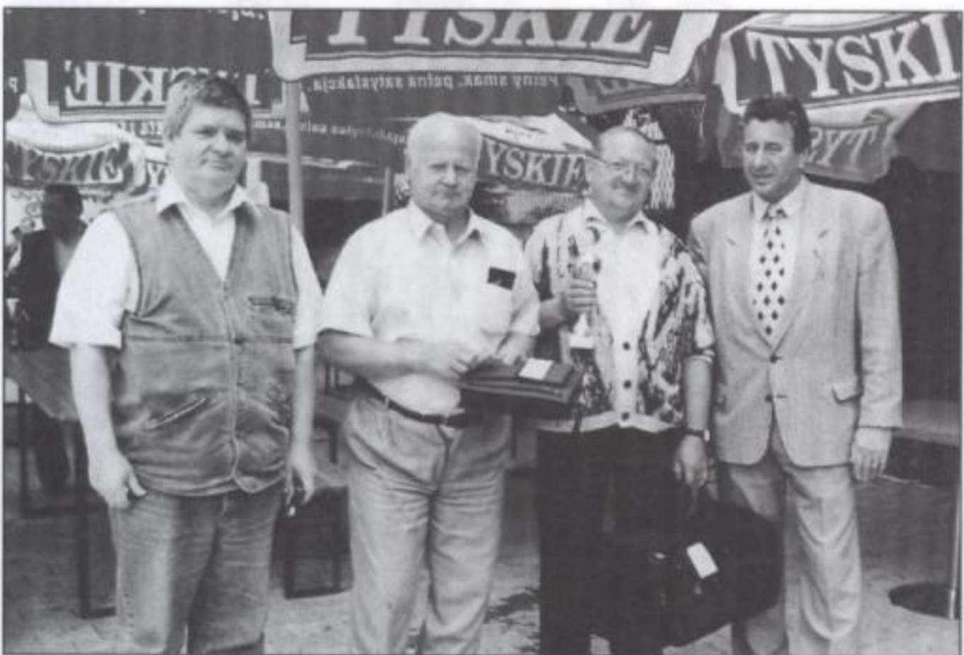
Najlepsza trójka turnieju i przewodniczący Rady Gminy