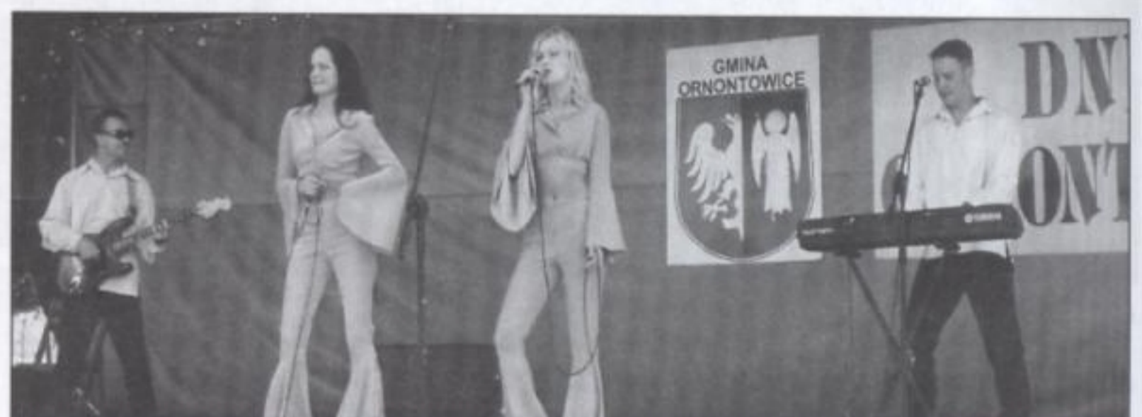
ABBA w wydaniu zespołu „Waterloo”