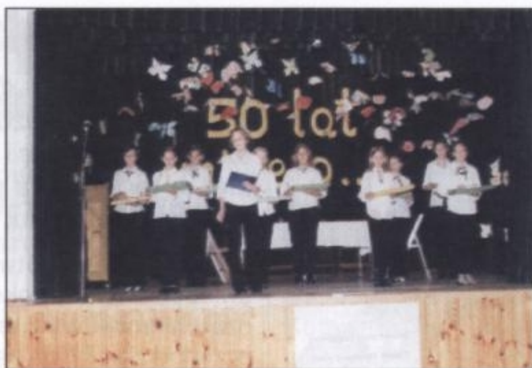
Program artystyczny w wykonaniu uczniów ornontowickiej Jubilatki