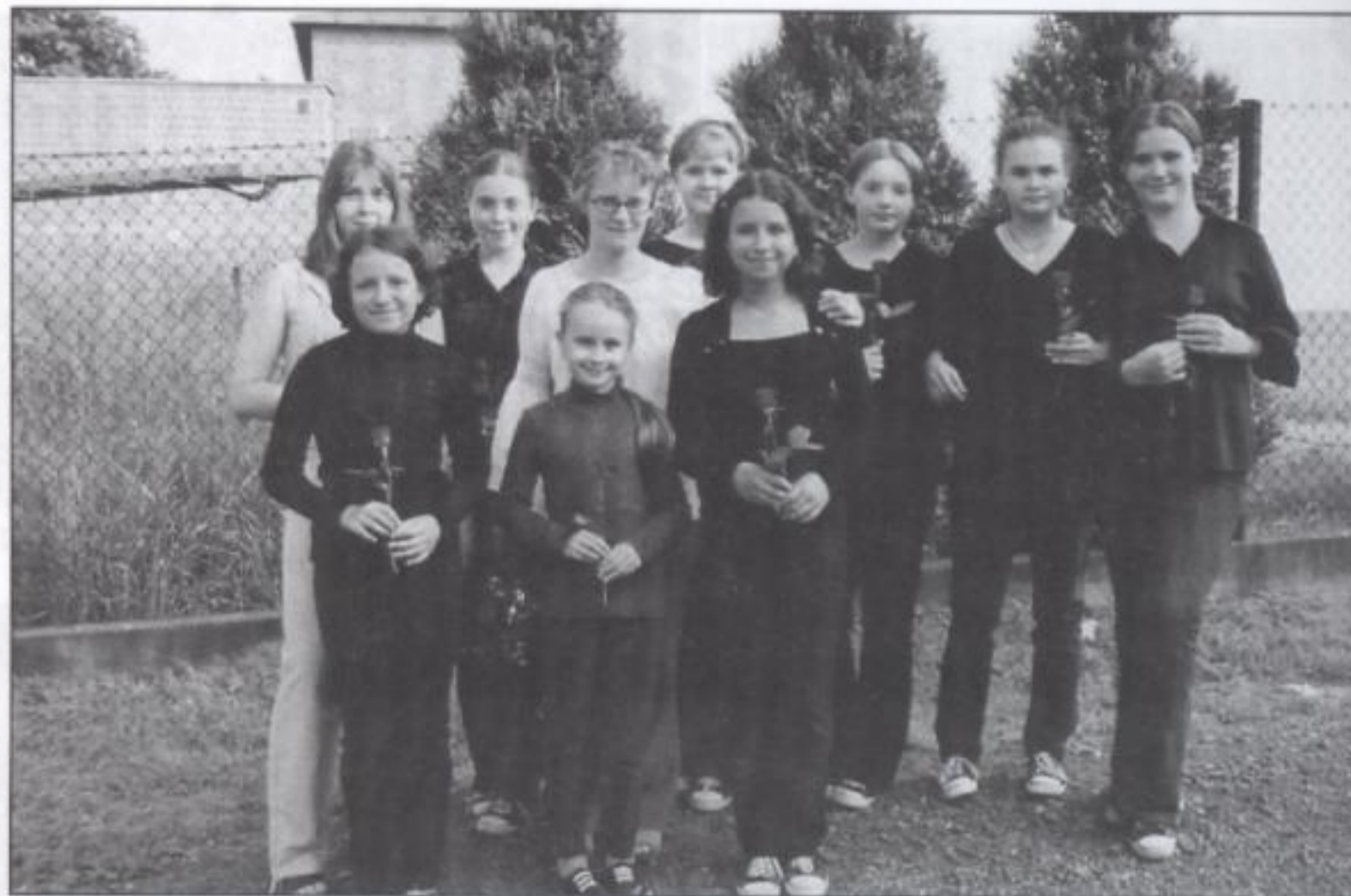
Grupa teatralna z Gminnego Domu Kultury w Ornontowicach

„Świat dziecka”, Dorota: „Ból, krzyk, strach, nieszczęścia, beznadzieja – oto czym jesteśmy na co dzień zasypywani przez media. Media, które mają ogromny wpływ na psychikę ludzką, zniekształcają rzeczywisty obraz świata, wypaczają nasze człowieczeństwo. Mimo to często ślepo wierzymy we wszystko co wmawia nam prasa, radio i telewizja. Nam, młodym, jest szczególnie trudno odnaleźć się w tym chaosie.