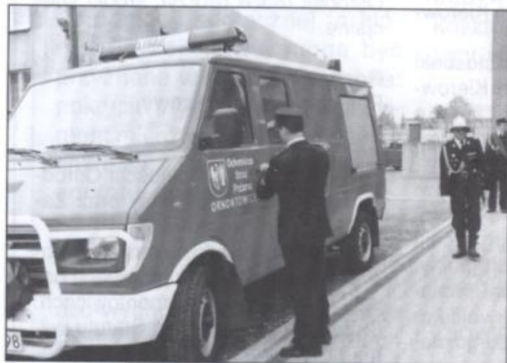
...Chwilę po wręczeniu kluczyków na nowiutkiego wozu strażackiego