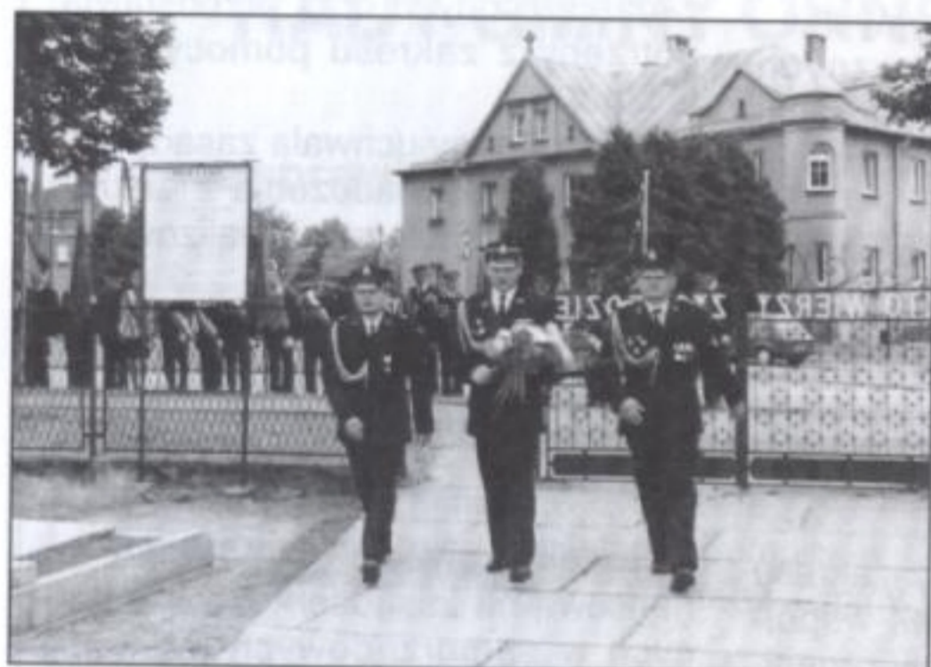
Na cmentarzu delegacja OSP złożyła symboliczną wiązkę kwiatów