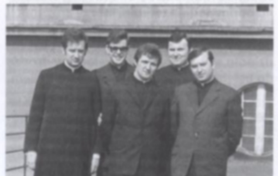
Tu jako student IV roku Wyższego Śląskiego Seminarium Duchownego w Krakowie (pierwszy z lewej)