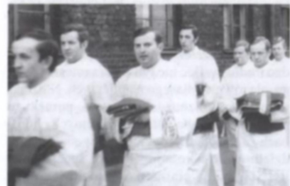
Święcenia diakonalne (w kościele p.w. św. św. Piotra i Pawła w Świętochłowicach) otrzymał z rąk ks. biskupa Czesława Domina