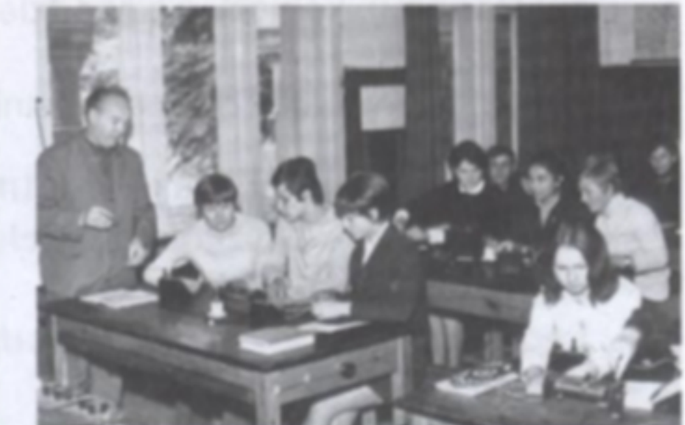
Zajęcia dydaktyczne w pracowni fizycznej Technikum Rolniczego – pierwsza połowa lat 70.