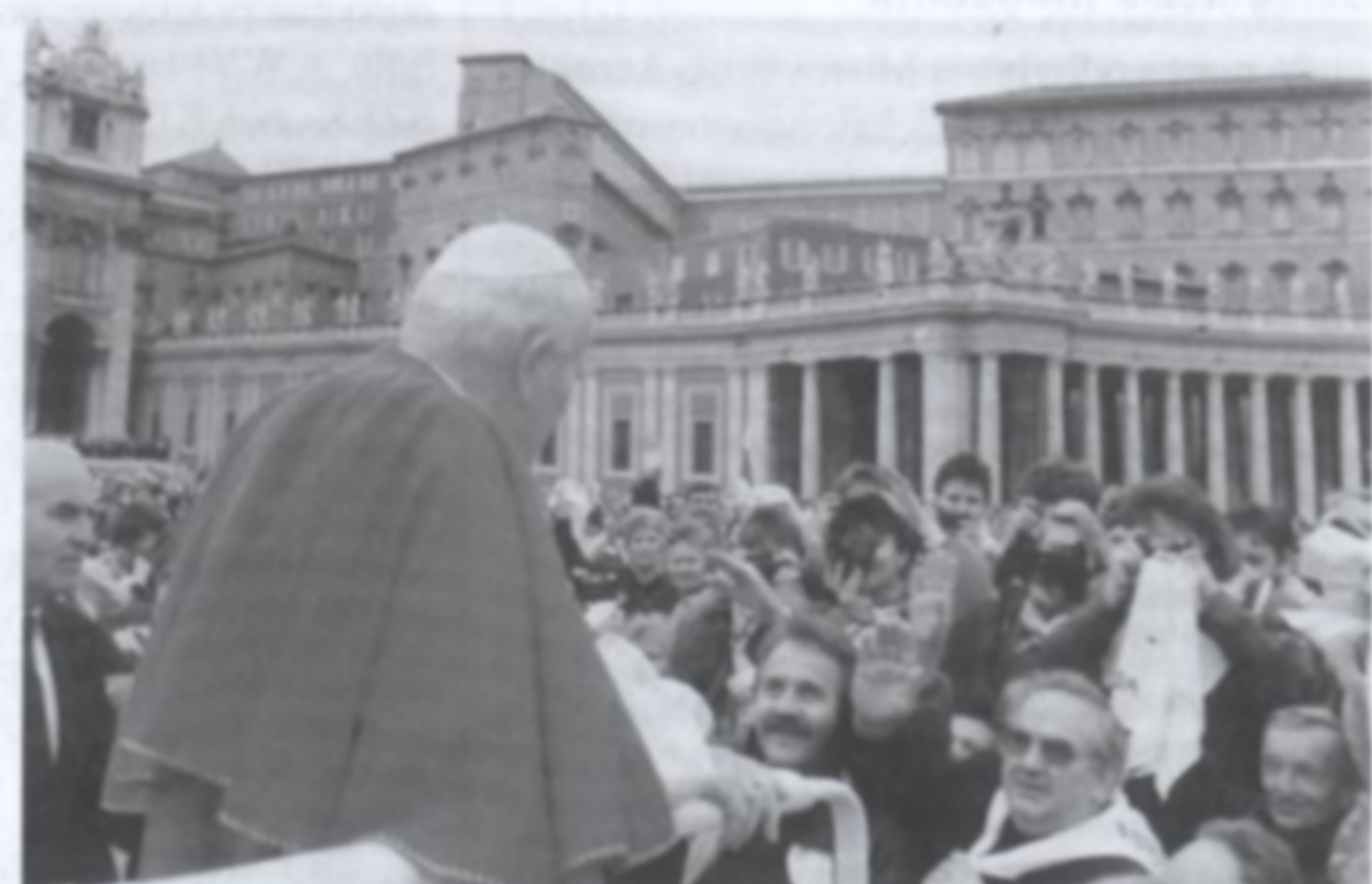
Pierwsza ornontowicka pielgrzymka parafialna w marcu 1993 r. - spotkanie z Ojcem Świętym Janem Pawłem II na Placu Św. Piotra w Watykanie