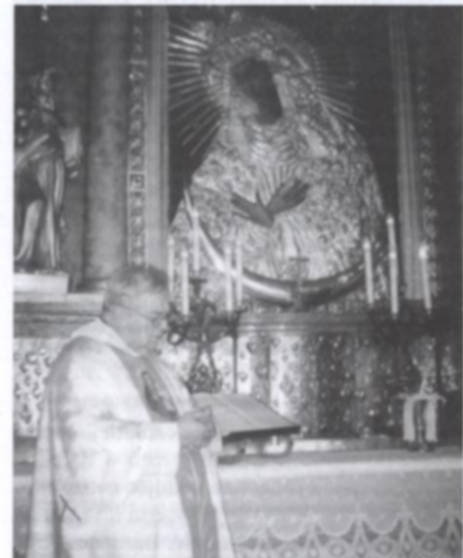
Przed ostrobramskim wizerunkiem Matki Boskiej na Litwie

Szczególnie miejsce w jego duszpasterskiej posłudze zajmuje ruch pielgrzymkowy... Lourdes, Fatima, Litwa, Ukraina, Słowacja, oczywiście Rzym i Watykan to jedne z wielu miejsc i krajów, które odwiedzał wspólnie z mieszkańcami Ornontowic. Od kilkunastu lat obecny jest także przy niemal wszystkich uroczystościach związanych m.in. z działalnością lokalnego samorządu, placówek oświatowych i miejscowych organizacji społeczno-kulturalnych.