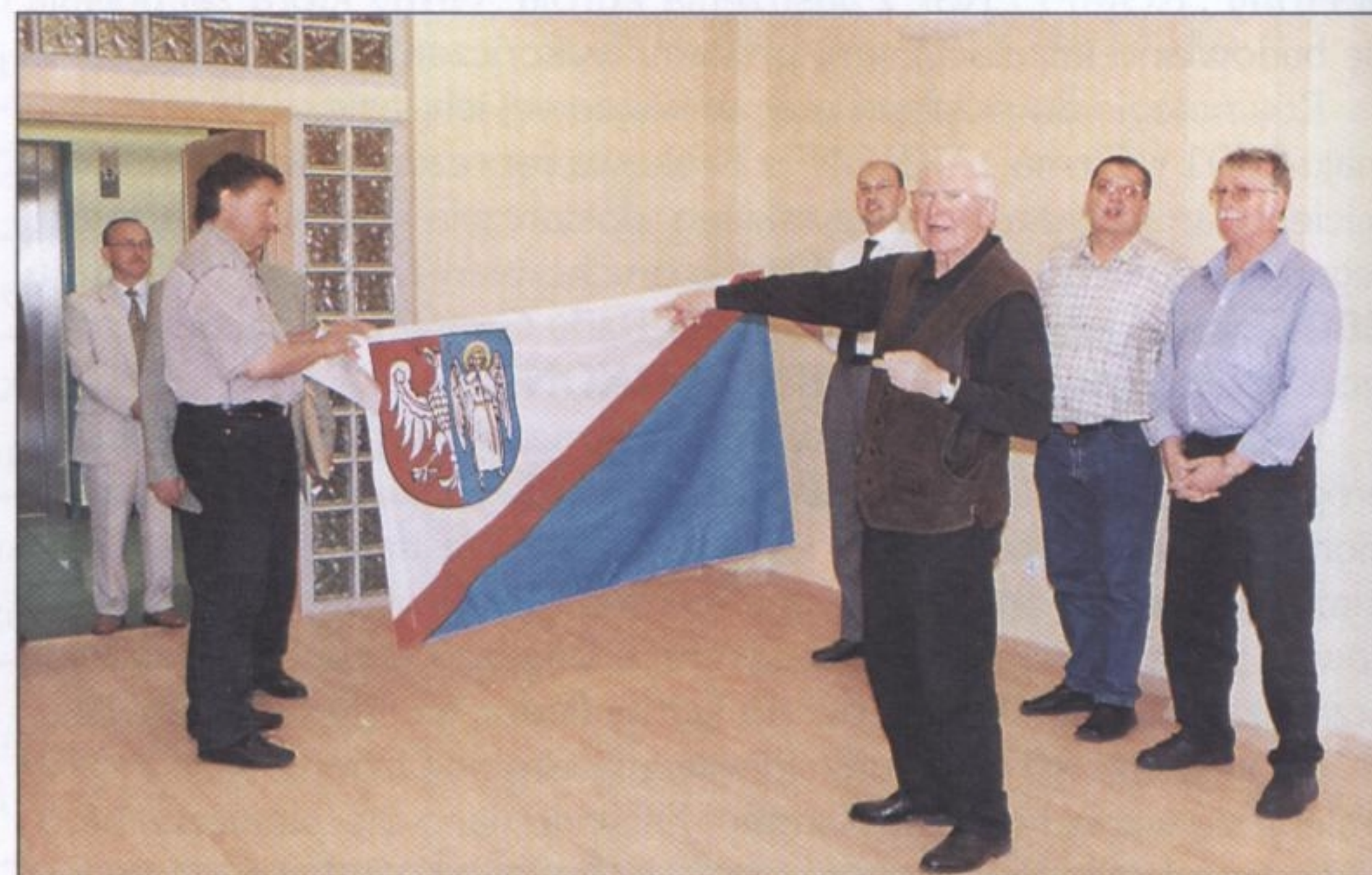
Rozmowa o sytuacji finansowej gminy Ornontowice