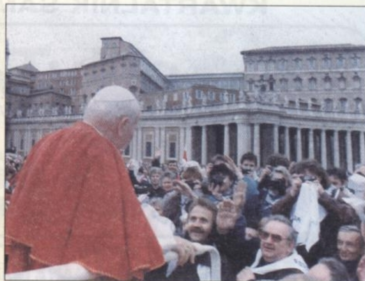
MARZEC 1993 R. – pierwsza parafialna pielgrzymka z Ornontowic