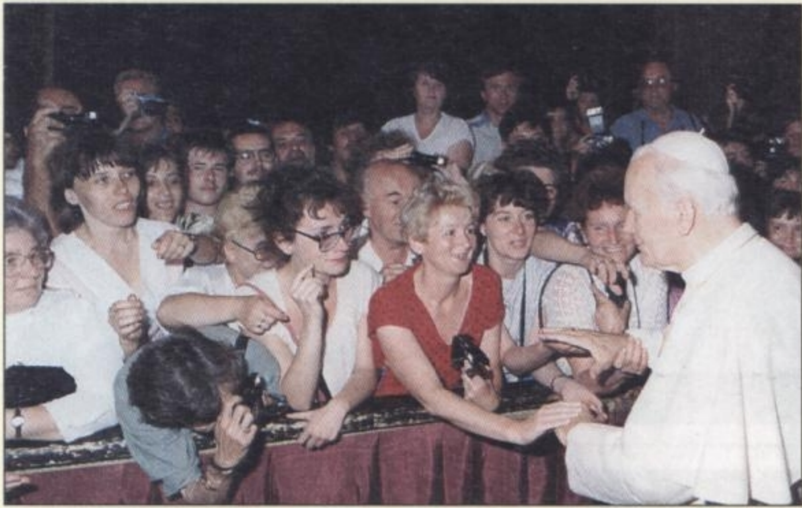
LIPIEC 1990 R. – Bazylika Św. Piotra