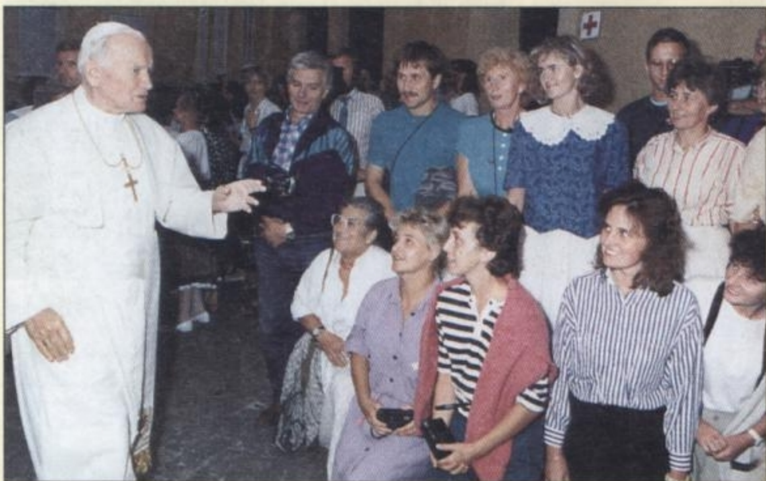
20 WRZEŚNIA 1990 R. – audiencja w letniej rezydencji papieskiej, Castel Gandolfo