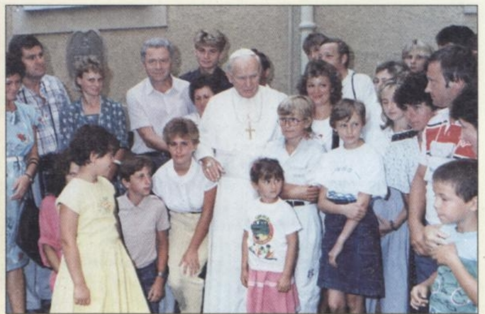
11 SIERPNIA 1989 R. – Castel Gandolfo