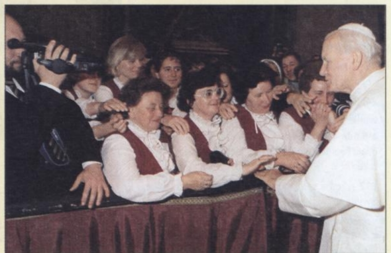
PAŹDZIERNIK 1991 R. – Bazylika Św. Piotra