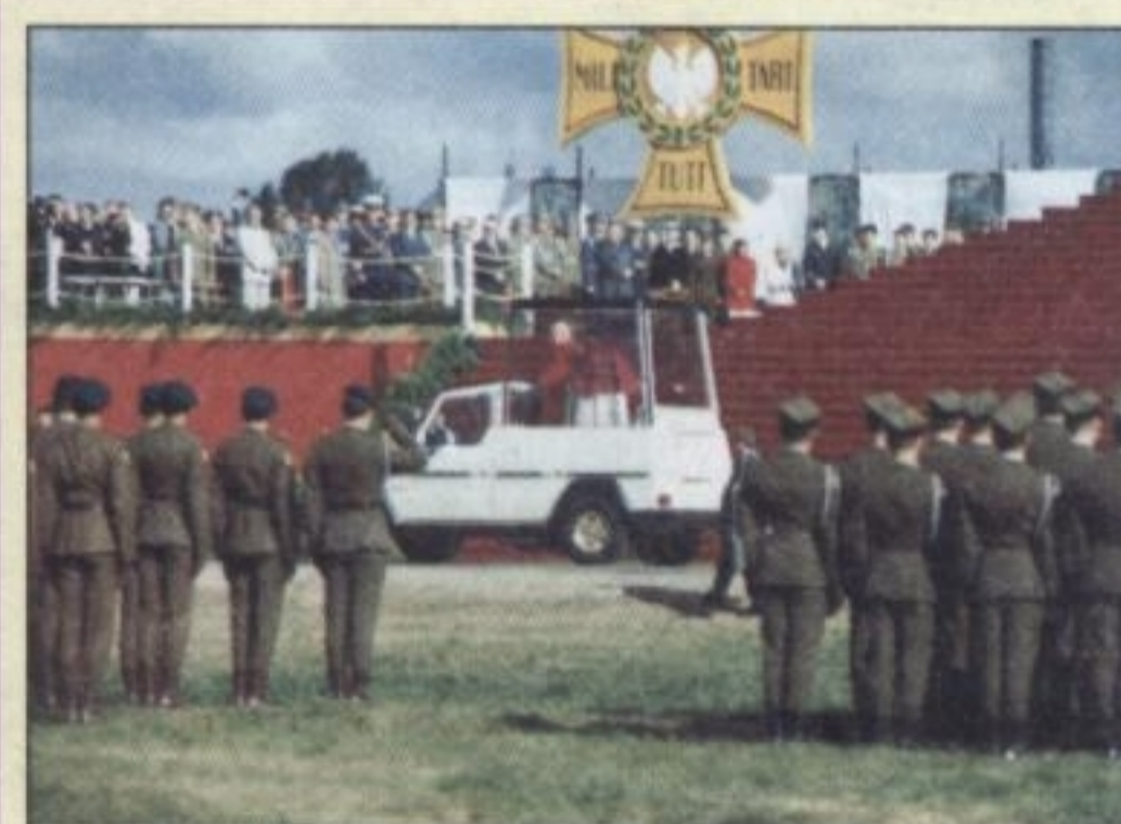
1991 R. – spotkanie Ojca Świętego z żołnierzami w Zegrzu Pomorskim; pamiątkowa fotografia Marka Wiemickiego z okresu jego służby wojskowej