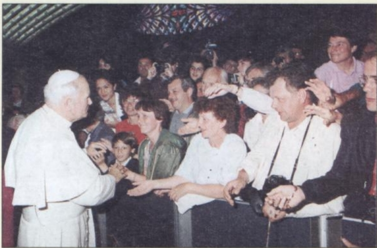
1989 R. – spotkanie z Ojcem Świętym podczas wycieczki do Rzymu