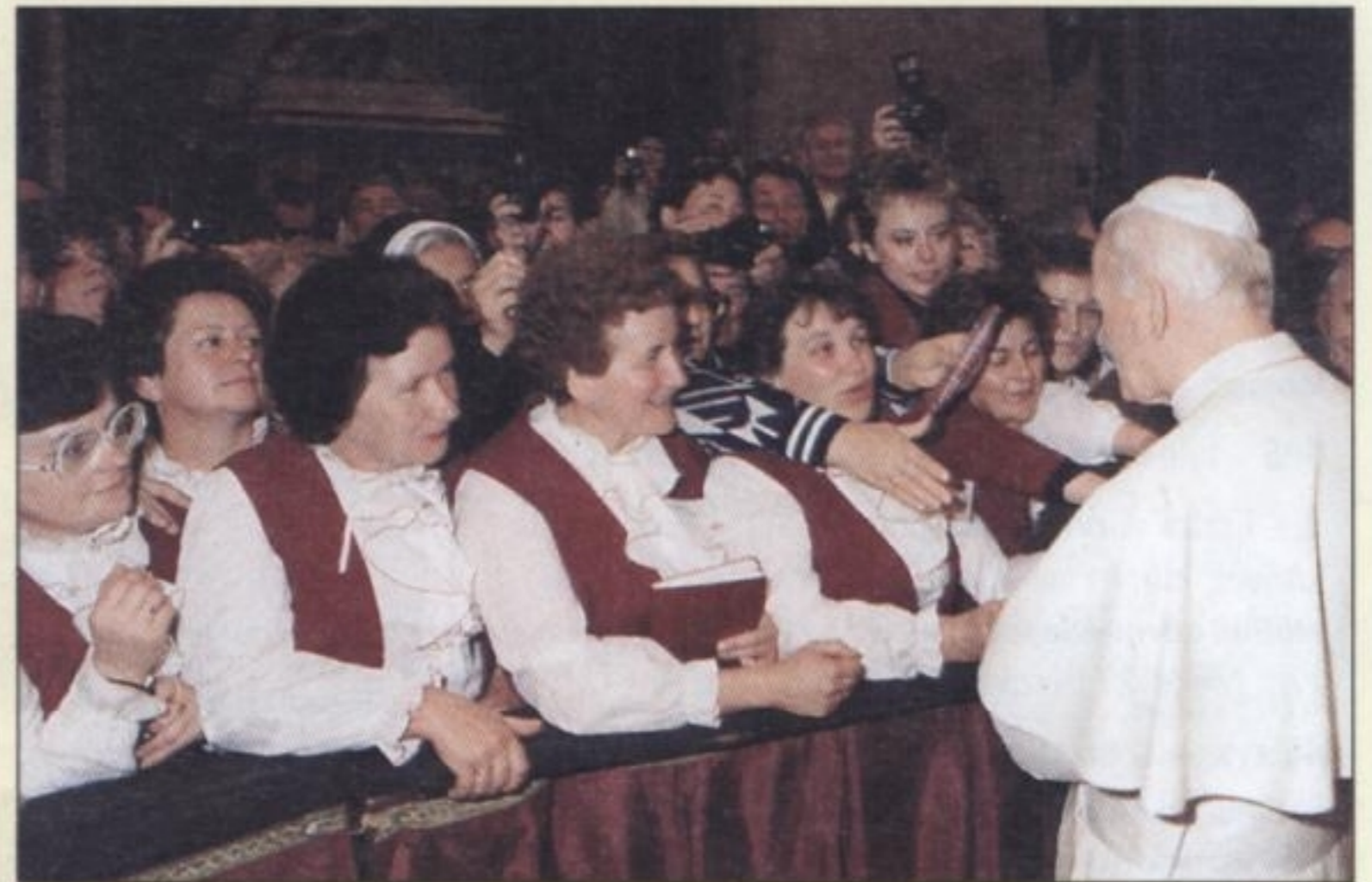
1991 R. – członkowie chóru „Jutrzenka” w Bazylice Św. Piotra