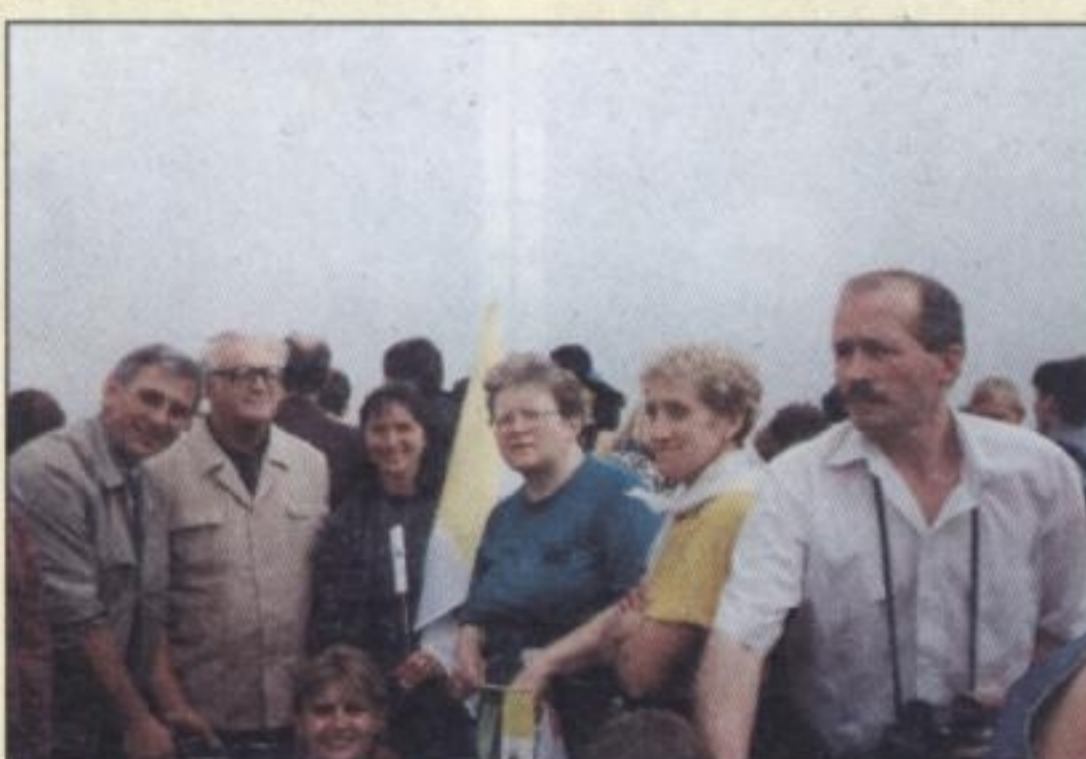
17 CZERWCA 1999 R. – grupa mieszkańców Ormontowic, która przybyła na spotkanie z Ojcem Świętym na lotnisku w Gliwicach