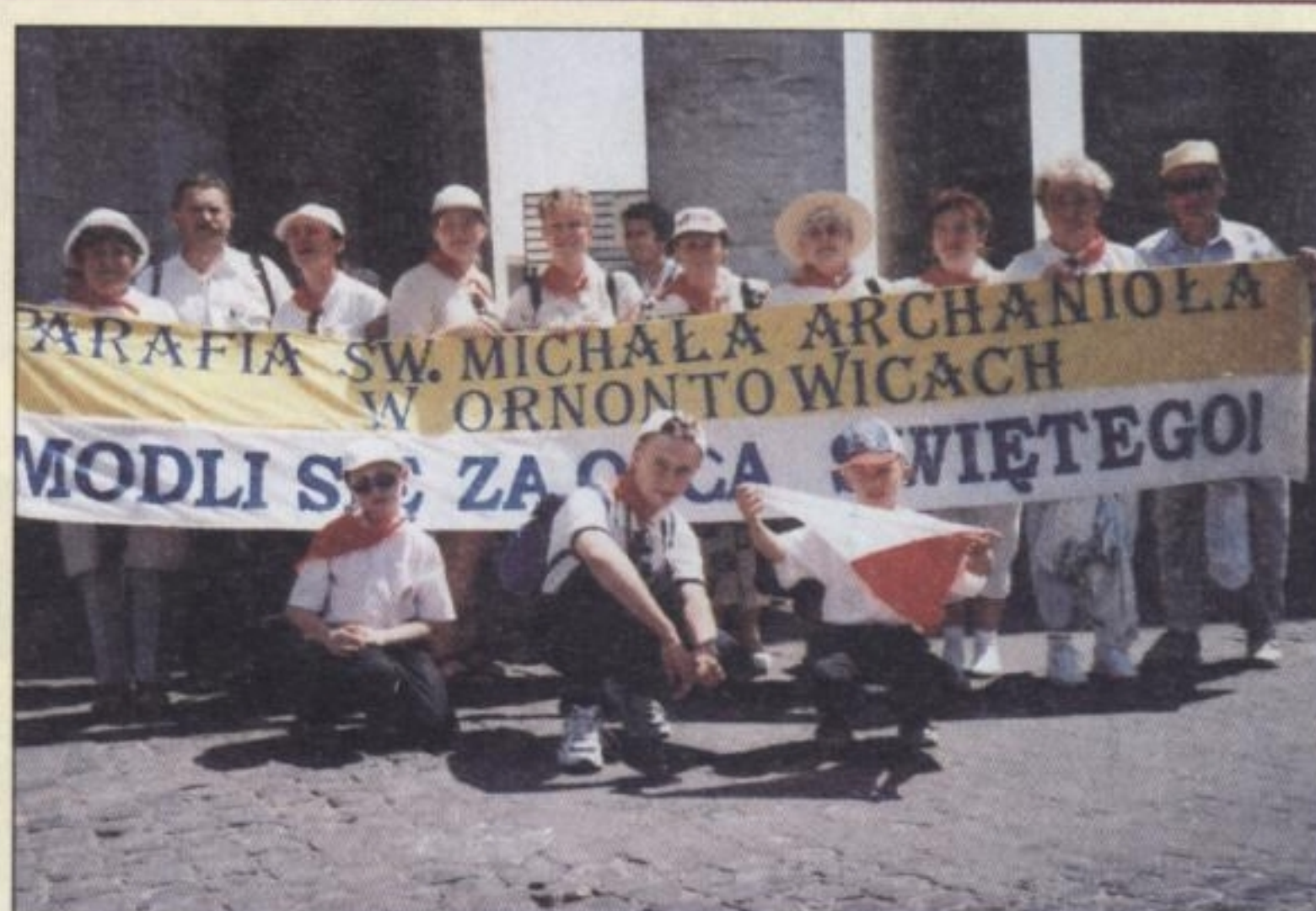
4 LIPCA 2000 R. – Ojciec Święty podczas objazdu Placu Św. Piotra; obok – grupa pielgrzymów z Ornontowic