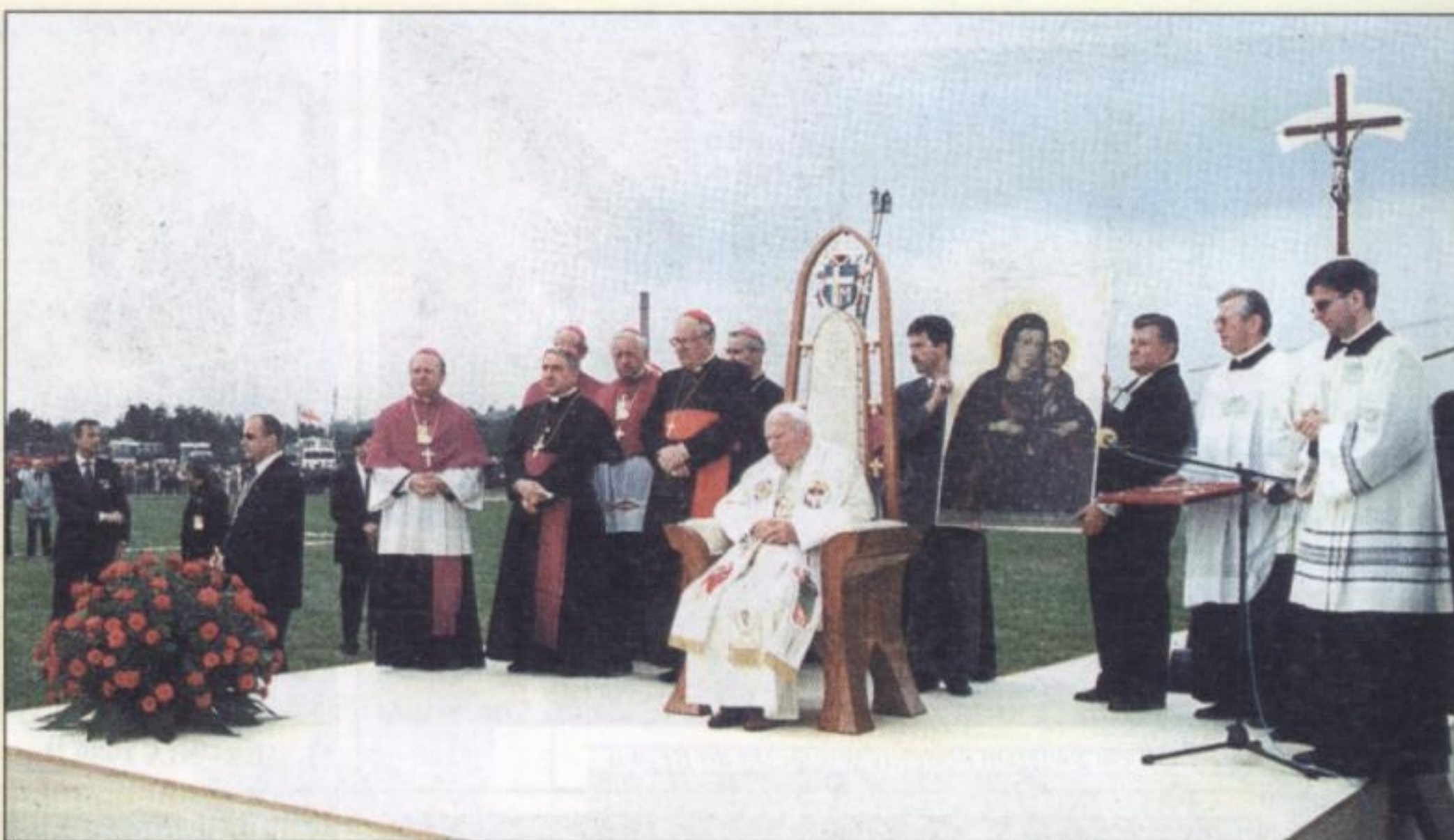
17 CZERWCA 1999 R. - Ojciec Święty w Gliwicach [zdj. z książki „Bóg zapłać za waszą świętą cierpliwość”; wyd. Oficyny Wydawniczej „Kwadrat” i Kurii Diecezjalnej w Gliwicach]

Tadeusz Kijonka, „Śląsk”, maj 2005; Narodowe Rekolacje