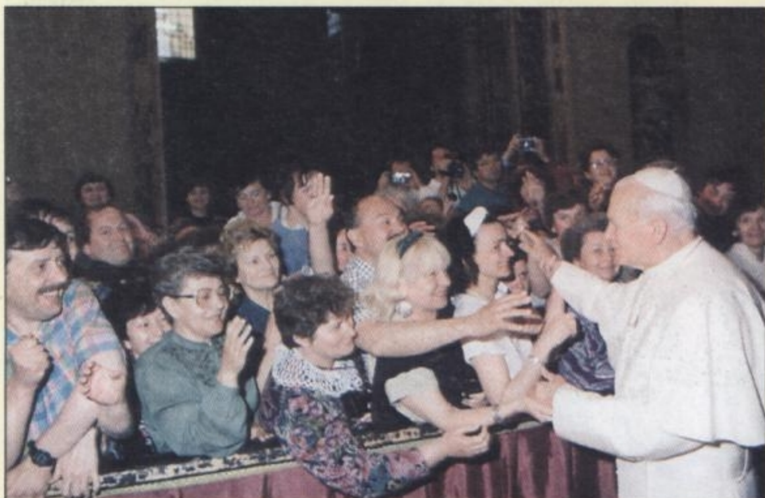
1991 R. – spotkanie z Ojcem Świętym w Bazylice Św. Piotra, wycieczka Orbisu z Rybnika