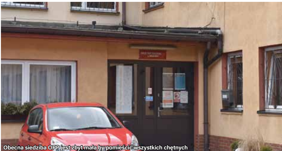
Obecna siedziba OPP jest zbyt mała by pomieścić wszystkich chętnych