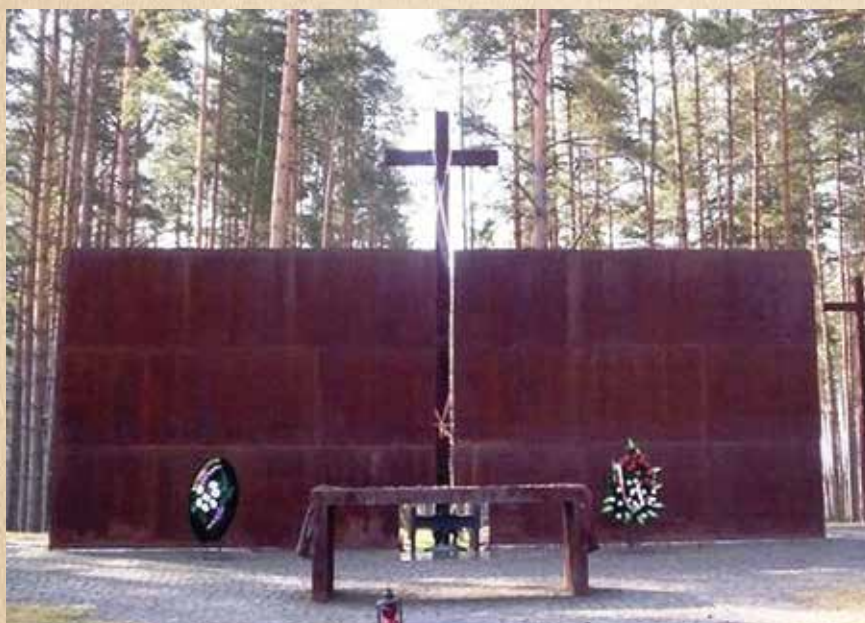
Pomnik pomordowanych w Miednoje