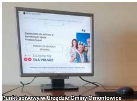
Punkt spisowy w Urzędzie Gminy Ornontowice

Spis jest naprawdę łatwy! Wystarczy wejść na stronę internetową Narodowego Spisu Powszechnego 2021 (NSP 2021) oraz skorzystać z wygodnej i bezpiecznej aplikacji spisowej. Zrób to jak najszybciej!