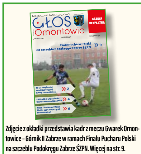
Zdjęcie z okładki przedstawia kadr z meczu Gwarek Ornontowice - Górnik II Zabrze w ramach Finału Pucharu Polski na szczelbu Podokręgu Zabrze SZPN. Więcej na str. 9.