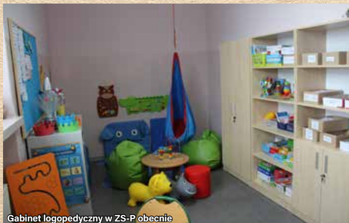
Gabinet logopedyczny w ZS-P obecnie