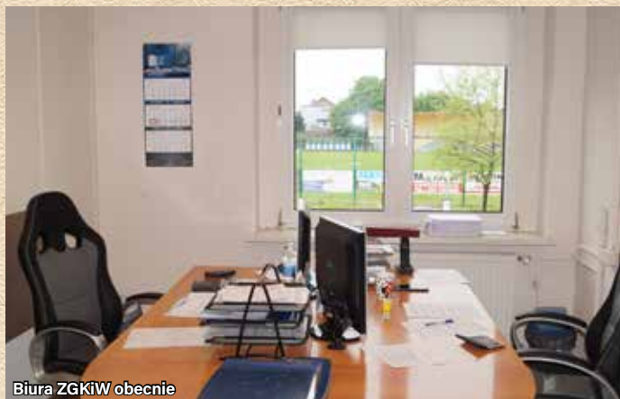
Biura ZGKiW obecnie