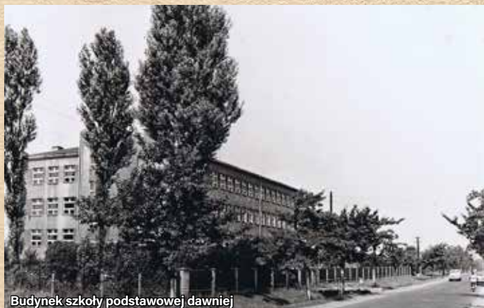
Budynek szkoły podstawowej dawniej

Z dniem 1 stycznia 1995 r. prowadzenie szkoły przejęła gmina, a placówka stała się szkołą samorządową. W latach 1999-2000 nastąpiło przekształcenie ośmioletniej szkoły podstawowej w szkołę sześciolletnią. Rok szkolny 2001-2002 został ogłoszony rokiem jubileuszu 50-lecia szkoły. Rok szkolny 2005-2006 rozpoczął się zmianą nazwy szkoły na Zespół Szkolno-Przedszkolny w Gminie Ornontowice.