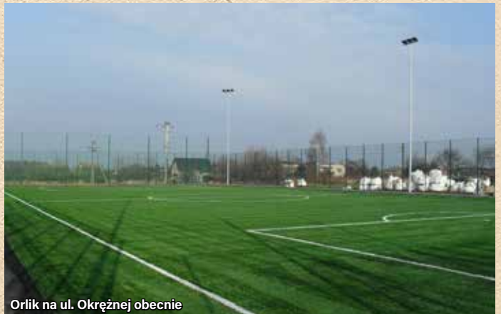
Orlik na ul. Okrężnej obecnie