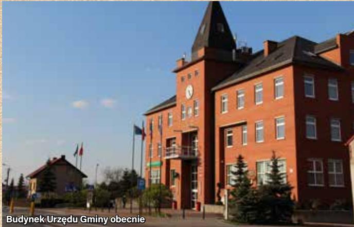
Budynek Urzędu Gminy obecnie

Adres: ul. Zwycięstwa 26 a • Lata budowy: 1996 – 2001 • Uroczyste otwarcie: 2 lipca 2001 r. • Powierzchnia: 2267,7 m 2