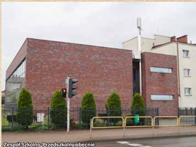
Zespół Szkolno-Przedszkolny obecnie