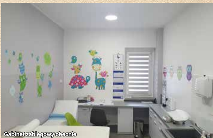
Gabinet zabiegowy obecnie