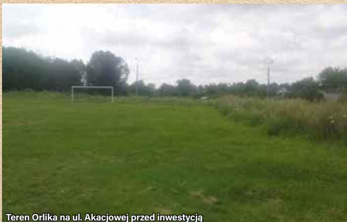
Teren Orlika na ul. Akacjowej przed inwestycją