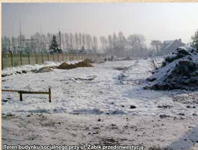
Teren budynku socjalnego przy ul. Żabik przed inwestycją