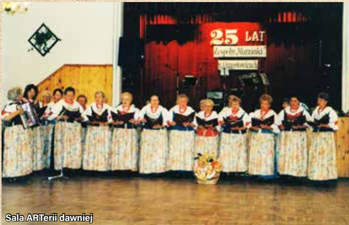
Sala ARTerii dawniej

Tekst i zdjęcia: ARTeria CKiP w Ornontowicach