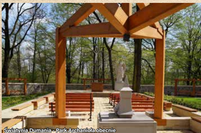
Świątynia Dumania - Park Archanioła obecnie