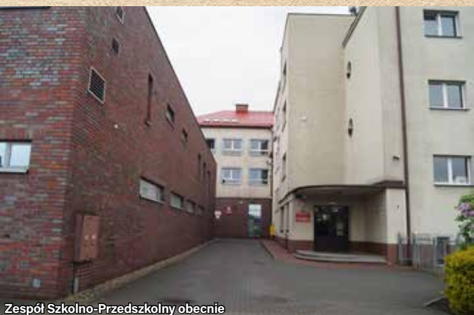
Zespół Szkolno-Przedszkolny obecnie