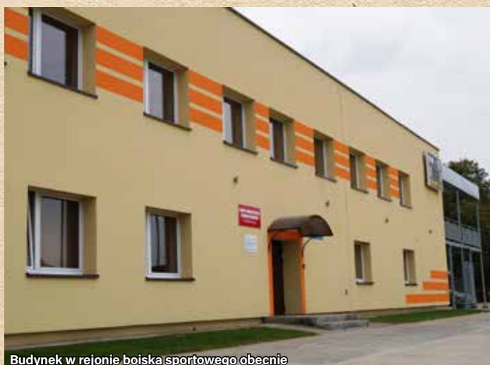
Budynek w rejonie boiska sportowego obecnie

Adres: ul. Zwycięstwa 7 b • Lata realizacji: 2012 – 2013