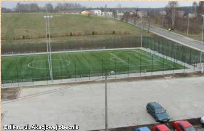
Orlik na ul. Akacjowej obecnie

Adres: ul. Akacjowa 1a i ul. Okrężna 6 • Lata budowy: 2009 – 2010