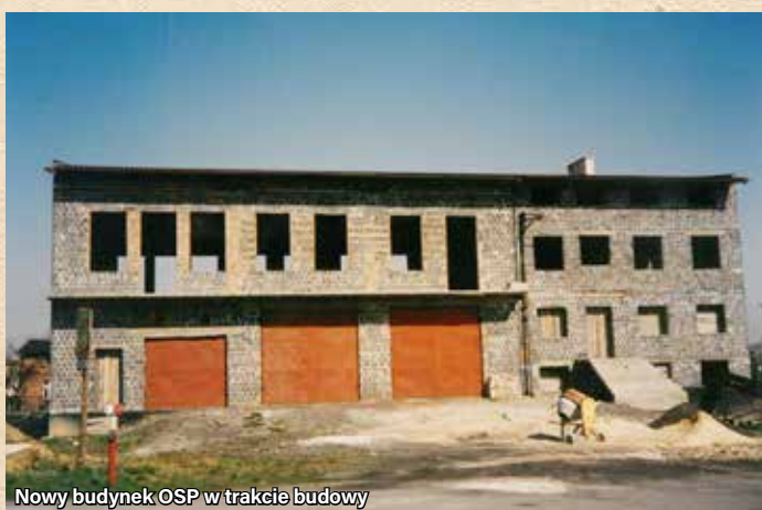
Nowy budynek OSP w trakcie budowy

Adres: ul. Bankowa 1 • Lata budowy: 1991 – 1997 • Uroczyste otwarcie: 1 września 1997 r. • Powierzchnia: ponad 1120 m 2