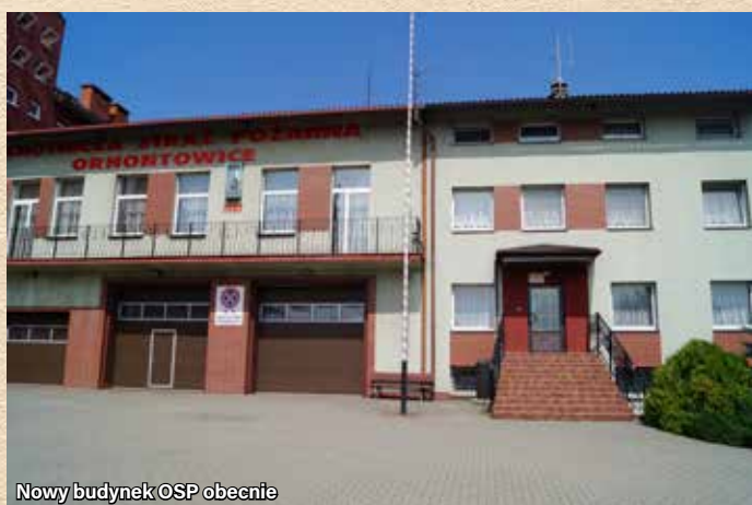
Nowy budynek OSP obecnie