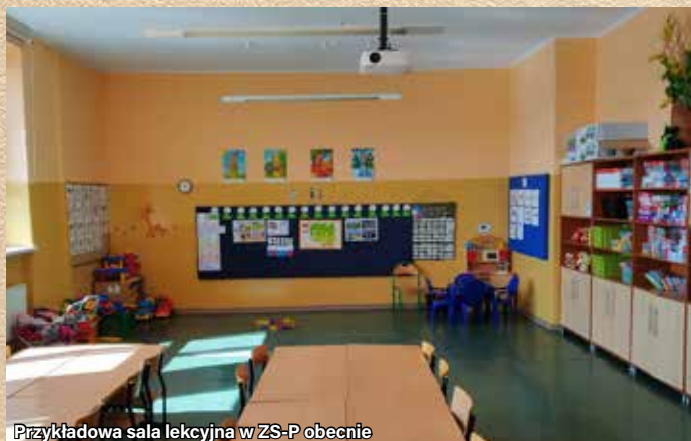
Przykładowa sala lekcyjna w ZS-P obecnie

Tekst i zdjęcia: Zespół Szkolno-Przedszkolny w Gminie Ornontowice