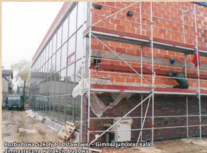
Rozbudowa Szkoły Podstawowej – Gimnazjum oraz sala gimnastyczna w trakcie budowy

Adres: ul. Zwycięstwa 7 • Lata budowy: 2003 – 2005