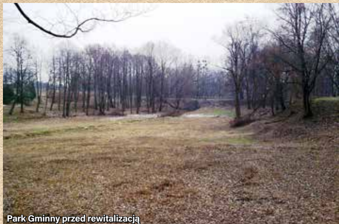
Park Gminny przed rewitalizacją