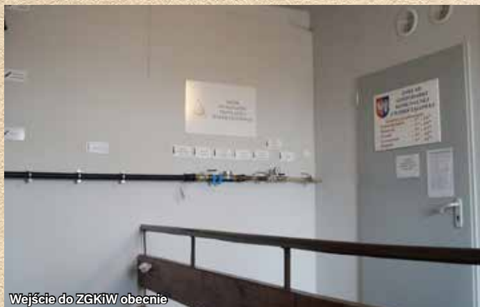
W wejście do ZGKiW obecnie

Tekst: Zakład Gospodarki Komunalnej i Wodociągowej w Ornontowicach