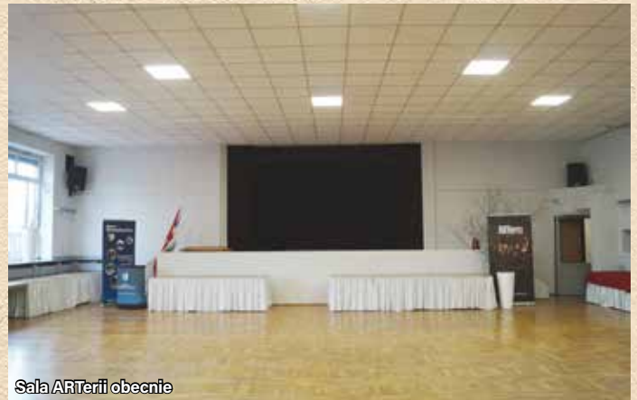
Sala ARTerii obecnie