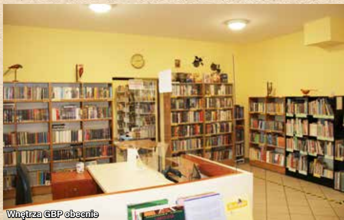
Wnętrze GBP obecnie

Tekst: Gminna Biblioteka Publiczna w Ornontowicach