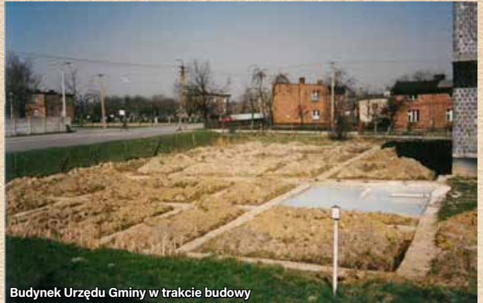
Budynek Urzędu Gminy w trakcie budowy