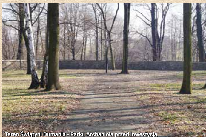
Teren Świątyni Dumania - Parku Archanioła przed inwestycją