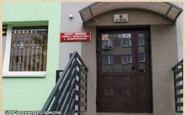
GOPS z zewnątrz obecnie