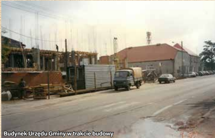
Budynek Urzędu Gminy w trakcie budowy