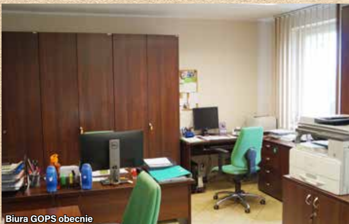
Biura GOPS obecnie

Na początku działalności siedziba Ośrodka mieściła się w byłym budynku Urzędu Gminy Ornontowice przy ul. Zwycięstwa 26. Zwiększające się zadania, a zatem konieczność zwiększenia zatrudnienia spowodowało, że od 7 grudnia 1993 r. Ośrodek zmienił swoją siedzibę, przenosząc się do wyremontowanego pomieszczenia w budynku GKS Gwarek przy ulicy Zwycięstwa 7B. Od lipca 2000 r. nastąpiło