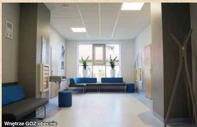
Wnętrze GOZ obecnie

Tekst i zdjęcia: Gminny Ośrodek Zdrowia w Ornontowicach