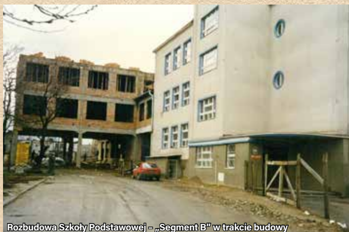
Rozbudowa Szkoły Podstawowej – „Segment B” w trakcie budowy

Adres: ul. Zwycięstwa 7 • Lata budowy: 1995 – 1998