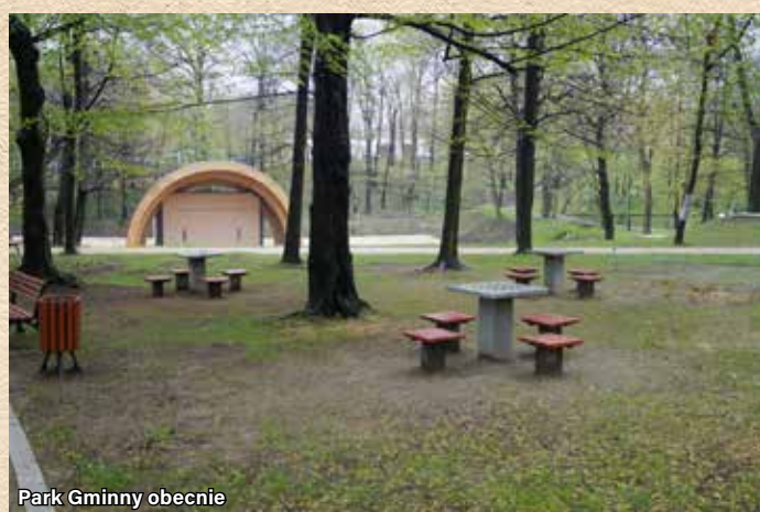
Park Gminny obecnie