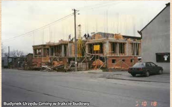
Budynek Urzędu Gminy w trakcie budowy