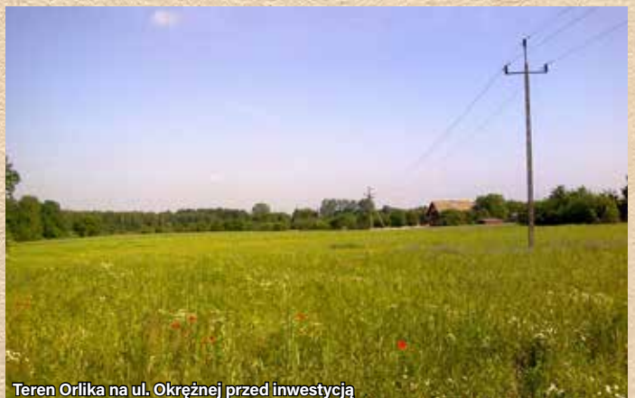
Teren Orlika na ul. Okrężnej przed inwestycją