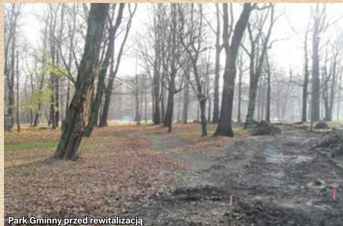
Park Gminny przed rewitalizacją