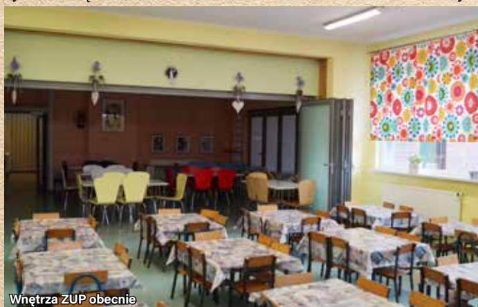
Wnętrze ZUP obecnie

Tekst: Zakład Usługowo-Pomocniczy dla Jednostek Oświatowych