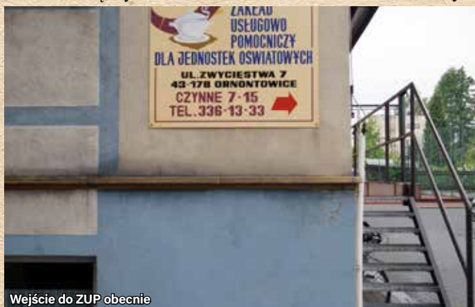
Wejście do ZUP obecnie