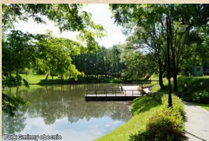
Park Gminny obecnie