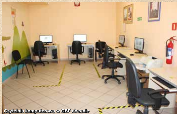
Czytelnia komputerowa w GBP obecnie