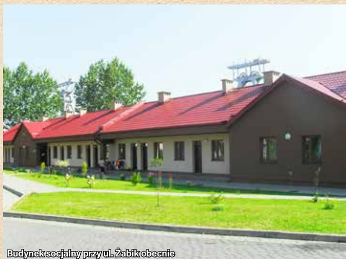
Budynek socjalny przy ul. Żabik obecnie