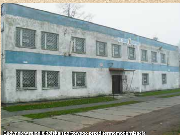
Budynek w rejonie boiska sportowego przed termomodernizacją