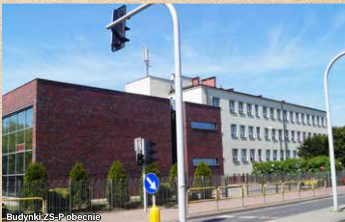
Budynki ZS-P obecnie