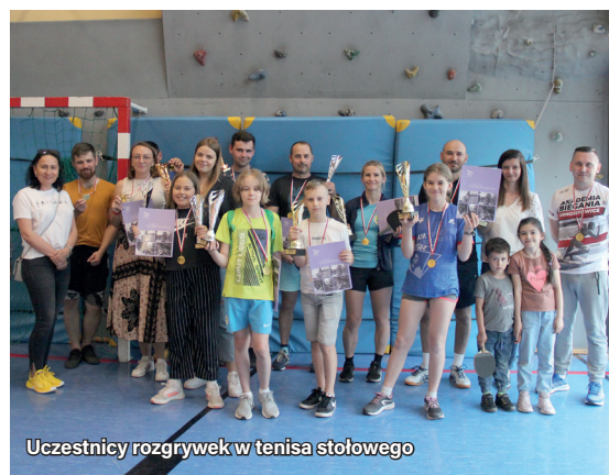
Uczestnicy rozgrywek w tenisa stołowego