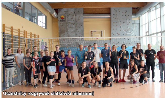
Uczestnicy rozgrywek siatkówki mieszanej