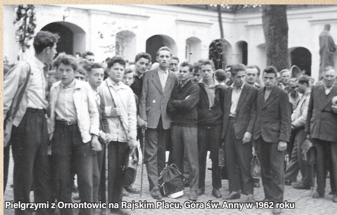
Pielgrzymi z Ornontowic na Rajskim Placu, Góra św. Anny w 1962 roku

Z biegiem czasu ruch pielgrzymkowy był tak popularny, że liczba uczestników przekraczała 200 osób. Prowadzenie tak dużej grupy było dla naszego przewodnika wielkim wezwaniem, tym bardziej