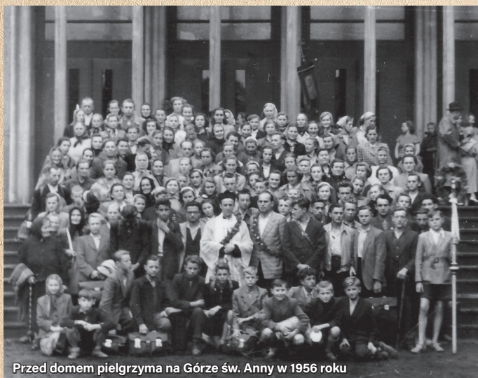
Przed domem pielgrzyma na Górze św. Anny w 1956 roku

Obchody główne zaczynały się w sobotę, w drugim dniu pielgrzymki, o godz. 13.00, najpierw przy kaplicy Trzech Krzyży z kazaniami i modlitwami, a później przy Domku Maryi z orkiestrą.