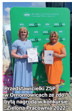
Przedstawicielki ZSP w Ornontowicach ze zdobytą nagrodą w konkursie „Zielona Pracownia 2022”

Dwie szkoły ponadpodstawowe z naszego powiatu otrzymały dofinansowanie z organizowanego przez Wojewódzki Fundusz Ochrony Środowiska i Gospodarki Wodnej w Katowicach konkursu „Zielona Pracownia 2022”.