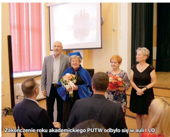
Zakończenie roku akademickiego PUTW odbyło się w auli I LO