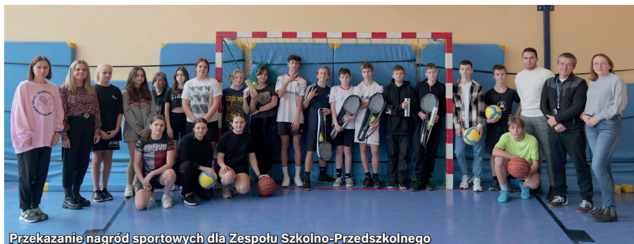
Przekazanie nagród sportowych dla Zespołu Szkolno-Przedszkolnego