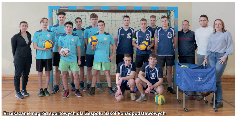
Przekazanie nagród sportowych dla Zespołu Szkół Ponadpodstawowych

Serdecznie dziękujemy za możliwość wzięcia udziału, a wszystkim uczestnikom bardzo dziękujemy.