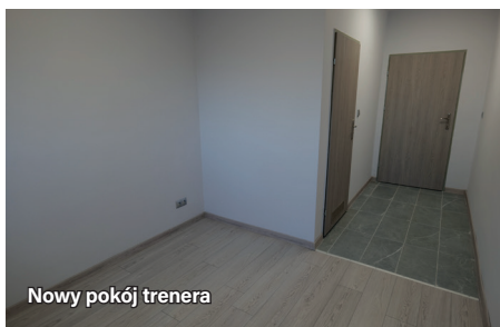
Nowy pokój trenera

Zadanie sfinansowane zostało z Rządowego Funduszu Inwestycji Lokalnych w kwocie 458 668,35 zł, pozostałe środki pochodzą z budżetu Gminy Ornontowice. Wartość całego przedsięwzięcia wyniosła ponad 500 tys. złotych.