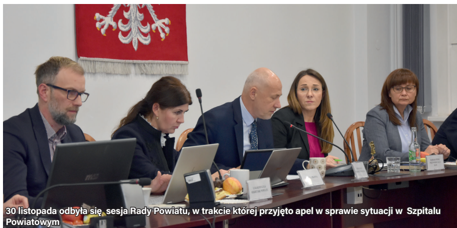
30 listopada odbyła się sesja Rady Powiatu, w trakcie której przyjęto apel w sprawie sytuacji w Szpitalu Powiatowym