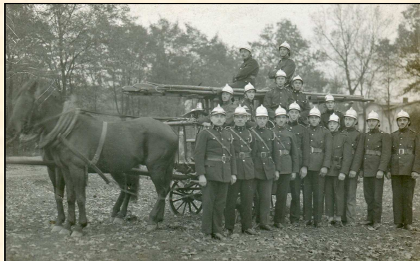
Jednostka OSP Ornontowice ze swoją sikawką