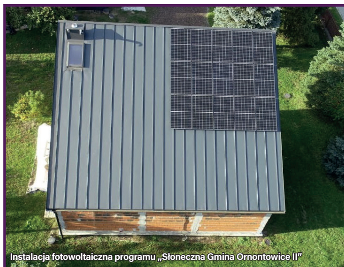
Instalacja fotowoltaiczna programu „Słoneczna Gmina Ornontowice II”