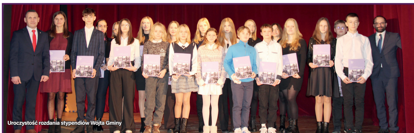
Uroczystość rozdania stypendiów Wójta Gminy