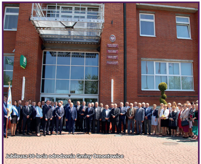
Jubileusz 30-lecia odrodzenia Gminy Ornontowice