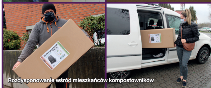
Rozdysponowanie wśród mieszkańców kompostowników