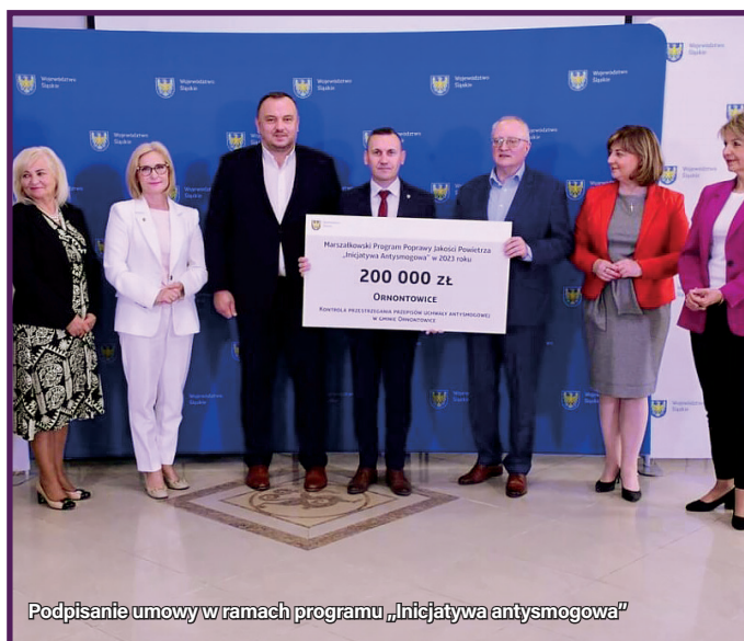
Podpisanie umowy w ramach programu „Inicjatywa antysmogowa”