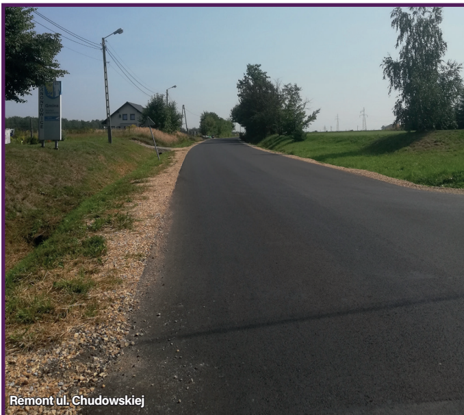
Remont ul. Chudowskiej