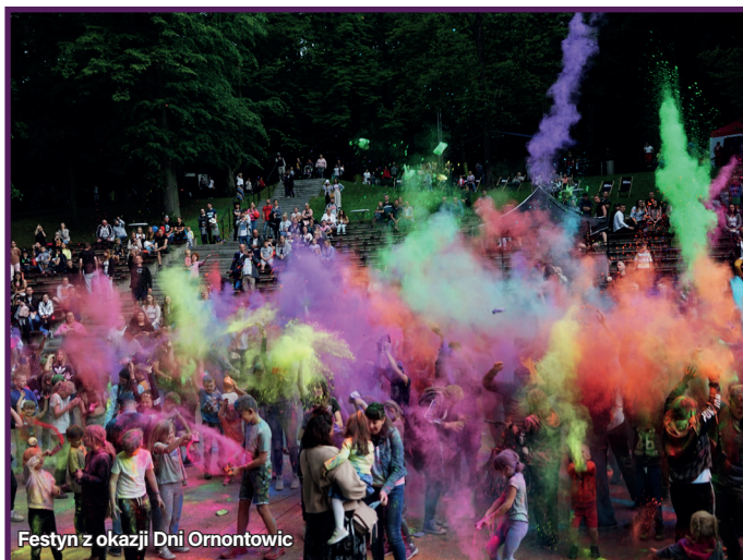
Festyn z okazji Dni Ornontowic