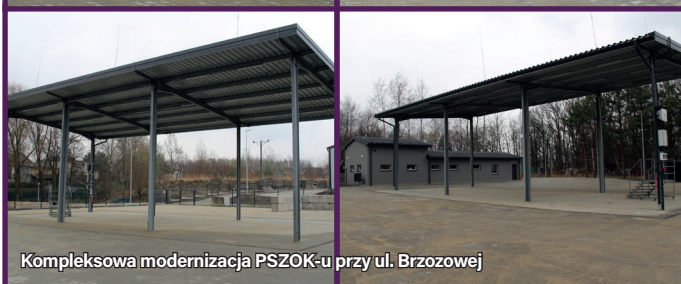
Kompleksowa modernizacja PSZOK-u przy ul. Brzozowej