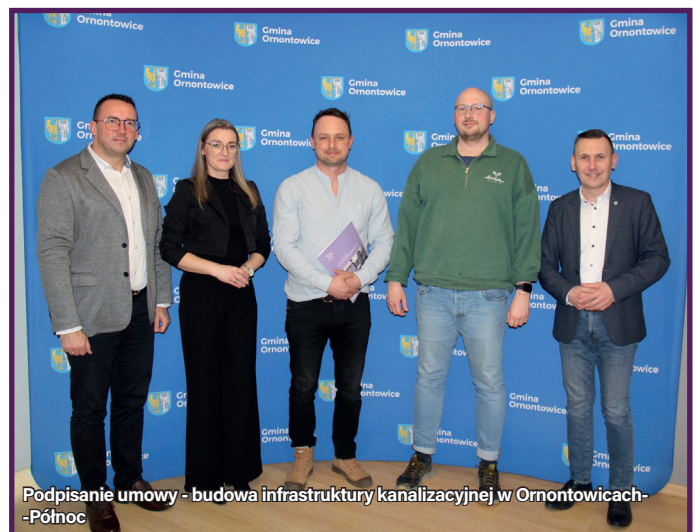
Podpisanie umowy - budowa infrastruktury kanalizacyjnej w Ornontowicach-Północ