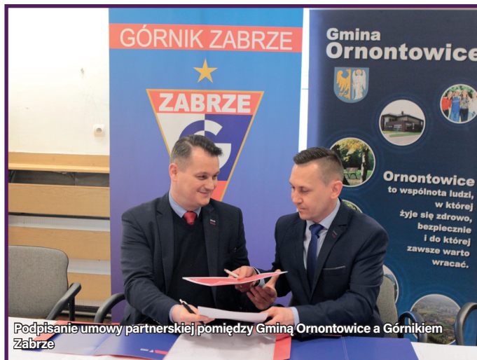
Podpisanie umowy partnerskiej pomiędzy Gminą Ornontowice a Górnikiem Zabrze