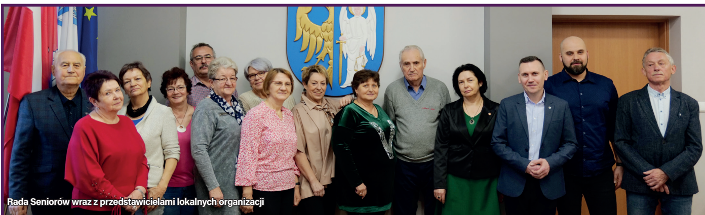
Rada Seniorów wraz z przedstawicielami lokalnych organizacji