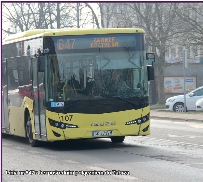
Linia nr 647 z bezpośrednim połączeniem do Zabrze