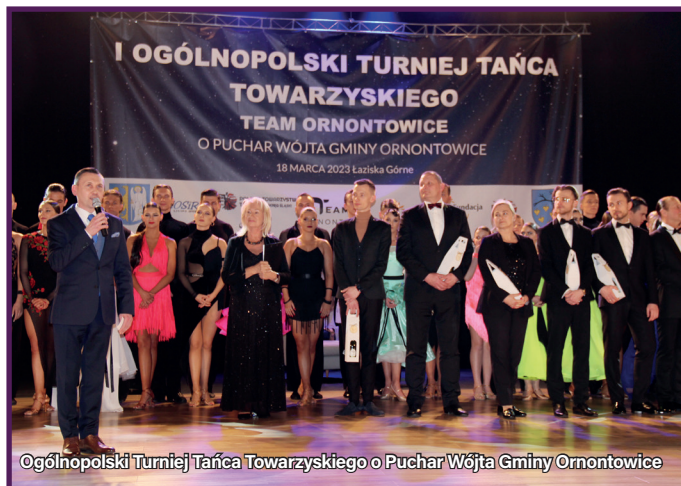
Ogólnopolski Turniej Tańca Towarzystwskiego o Puchar Wójta Gminy Ornontowice