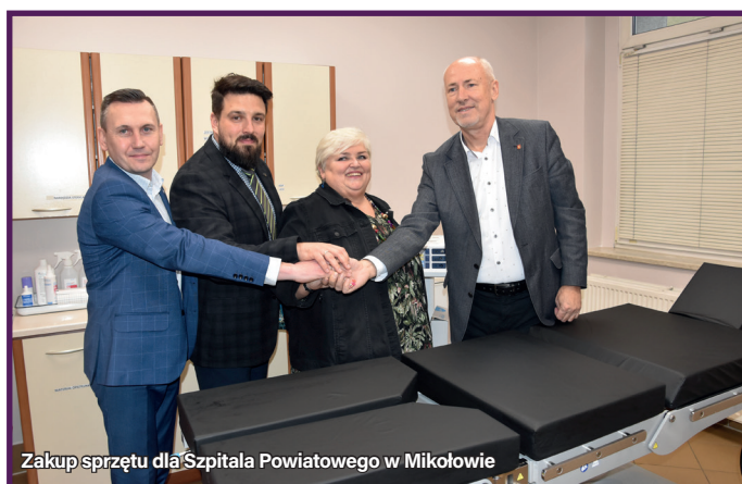
Zakup sprzętu dla Szpitala Powiatowego w Mikołowie