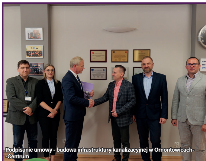
Podpisanie umowy - budowa infrastruktury kanalizacyjnej w Ornontowicach-Centrum