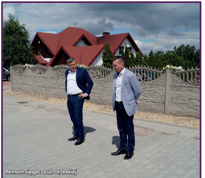
Remont sięgacza ul. Orzeskiej