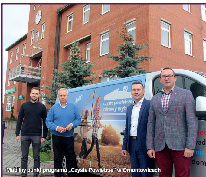
Mobilny punkt programu „Czyste Powietrze” w Ormontowicach