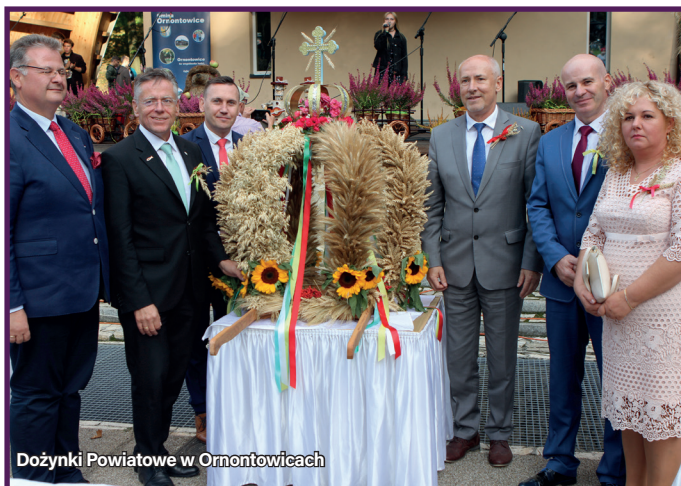
Dożynki Powiatowe w Ornontowicach