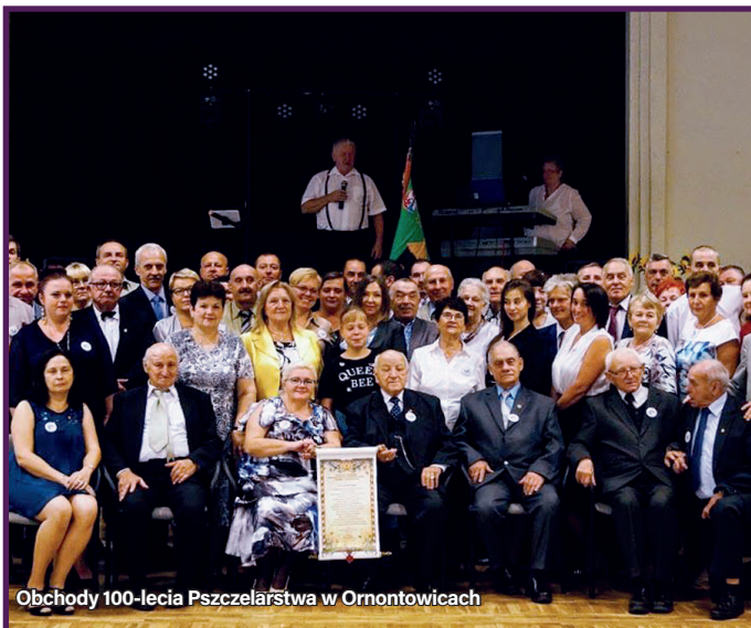
Obchody 100-lecia Pszczelarstwa w Ornontowicach