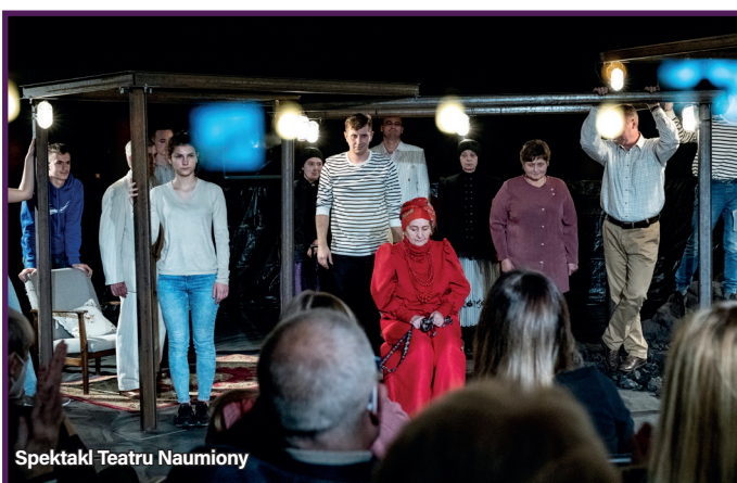
Spektakl Teatru Naumiony