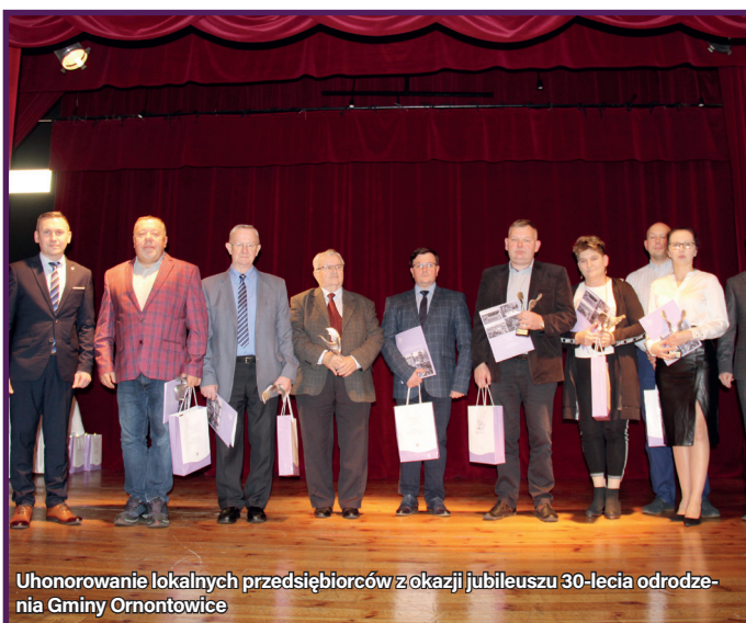
Uehonorowanie lokalnych przedsiębiorców z okazji jubileuszu 30-lecia odrodzenia Gminy Ornontowice