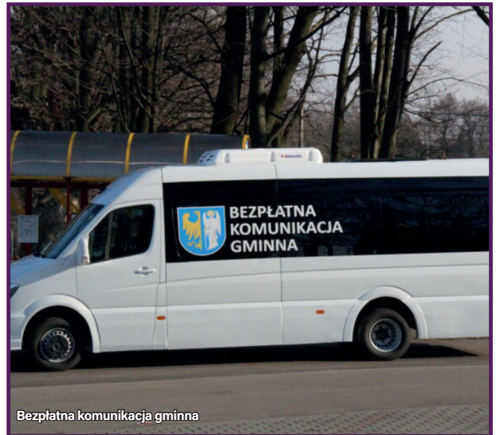
Bezpłatna komunikacja gminna