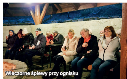
Wieczorne śpiewy przy ognisku