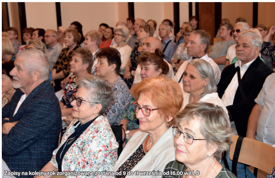
Zapisy na kolejny rok zorganizowane zostaną od 9 do 11 września od 16.00 w II LO

II LO w Mikołowie oraz szkoła w Dormagen współpracują ze sobą od lat, a obecna wymiana młodzieży została dofinansowana ze środków Polsko-Niemieckiej Współpracy Młodzieży.