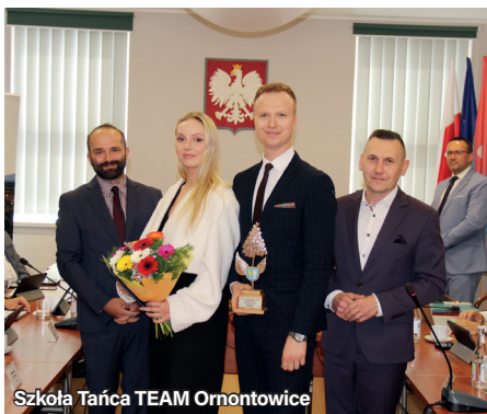
Szkoła Tańca TEAM Ornontowice

Serdecznie gratulujemy tegorocznym laureatom.