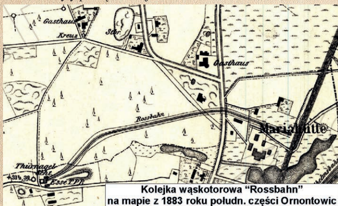
Kolejka wąskotorowa „Rossbahn” na mapie z 1883 roku połudn. części Ornontowic

Przy nowo powstałej stacji Orzesze wybudowano bocznice do pobliskiej huty żelaza (dzisiejsza huta szkła). Tor bocznicy 30 lat później był zaczątkiem nowej linii kolejowej z Orzesza do Gliwic przez Ornontowice . Od wspomnianej bocznicy poprowadzono odrębny tor konnej kolejki wąskotorowej tzw. Rossbahn do nieodległego szybu Türnagel kopalni Orzesche oraz zlokalizowanych obok niego hałd, na które wywożono żużel z huty żelaza. Wydobyty szybem węgiel był transportowany kolejką głównie na potrzeby huty, ale również dalej po przeładunku na bocznicy. Można przyjąć z przymrużeniem oka, że... takie były początki kolejnictwa w Ornontowicach .