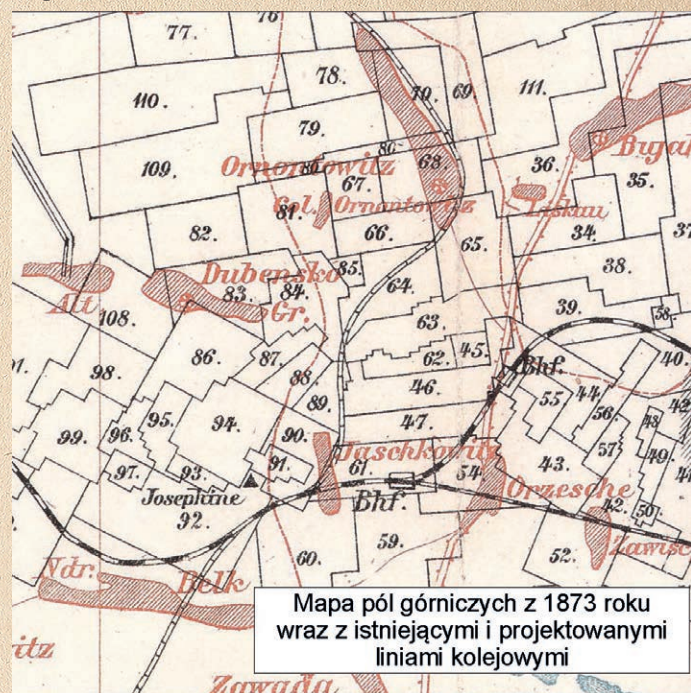
Mapa pól górniczych z 1873 roku wraz z istniejącymi i projektowanymi liniami kolejowymi

kolejne połączenia kolejowe w tym rejonie. Przymyślnie w latach 1867–1873 powstała koncepcja budowy linii skierowanej na południe jako odgałęzienie z istniejącej relacji Gliwice–Poremba (Zaborze) i łączącej się z austriacką koleją północną relacji Bohumin–Dziedzice . Według pierwotnego założenia linia ta miała omijać Orzesze i Żory , a jej przebieg przez Ornontowice różnił się znacznie od znanego nam dziś, co pokazano na poniższej mapie.