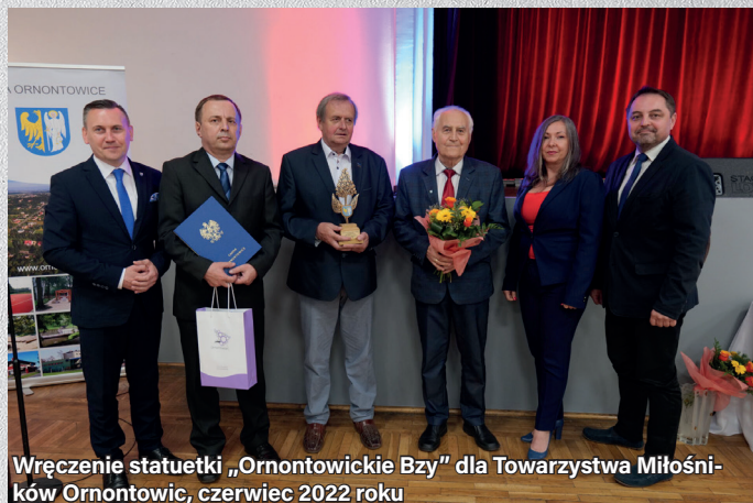
Wręczenie statuetki „Ornontowickie Bzy” dla Towarzystwa Miłośników Ornontowic, czerwiec 2022 roku