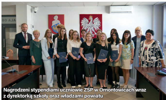
Nagrodzeni stypendiami uczniowie ZSP w Ornontowicach wraz z dyrektorką szkoły oraz władzami powiatu