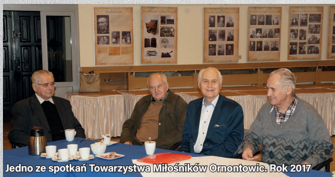
Jedno ze spotkań Towarzystwa Miłośników Ornontowic. Rok 2017

Bardzo lubił podróżować. Zwiedził niemal całą Europę, Rosję, Turcję, Mongolię, Izrael, Dominikanę oraz Wenezuelę.