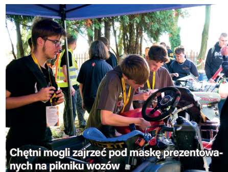
Chętni mogli zajrzeć pod maskę prezentowanych na pikniku wozów

Piknik motoryzacyjny był jednym z wydarzeń towarzyszących obchodom 100-lecia szkolnictwa zawodowego w Mikołowie. Jubileuszowa akademia odbyła się 18 października.