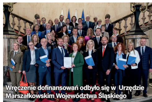
Wręczenie dofinansowań odbyło się w Urzędzie Marszałkowskim Województwa Śląskiego

Dzięki otrzymanemu dofinansowaniu w ramach tego projektu 637 uczniów powiatowych szkół branżowych I stopnia oraz techników będzie mogło wziąć udział w szkoleniach, kursach, stażach i praktykach oraz skorzystać z doradztwa i poradnictwa zawodowego. 26 nauczycieli praktycznej nauki zawodu będzie miało możliwość podnosić swoje kwalifikacje i kompetencje korzystając z tej formy wsparcia. Będzie można również doposażyć sale lekcyjne i utworzyć wirtualne pracownie w pięciu szkołach, dla których organem prowadzącym jest Powiat Mikołowski.