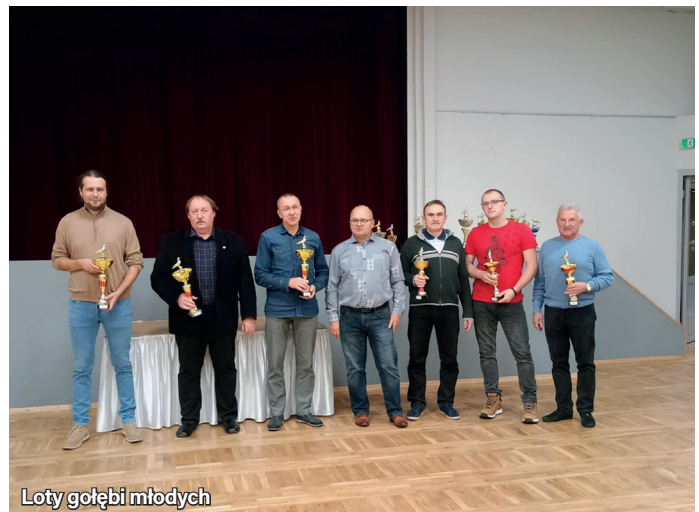
Loty gołębi młodych