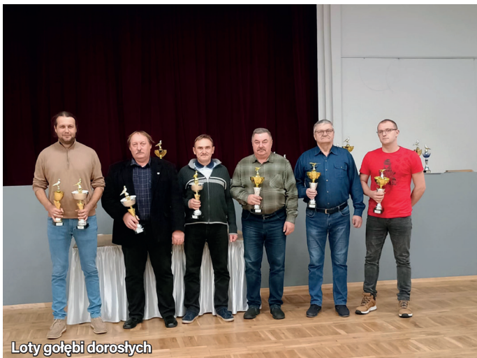
Loty gołębi dorosłych