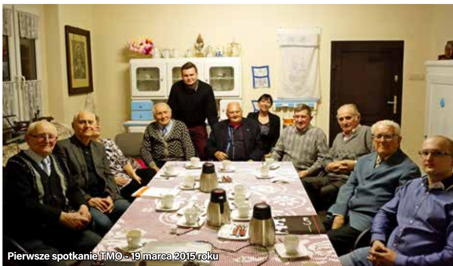
Pierwsze spotkanie TMO - 19 marca 2015 roku