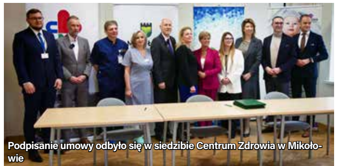
Podpisanie umowy odbyło się w siedzibie Centrum Zdrowia w Mikołowie

Dzięki porozumieniu, pacjentki onkologiczne zyskują możliwość przechowania materiału biologicznego (komórek jajowych) przed rozpoczęciem terapii przeciwnowotworowej, co daje im szansę na późniejsze skorzystanie z procedur wspomaganego rozrodu. W ramach współpracy planowane są także szkolenia dla personelu medycznego oraz dostęp do specjalistycznych konsultacji.