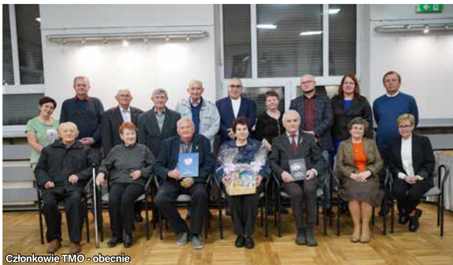
Członkowie TMO - obecnie

Tekst i zdjęcia: Towarzystwo Miłośników Ornontowic